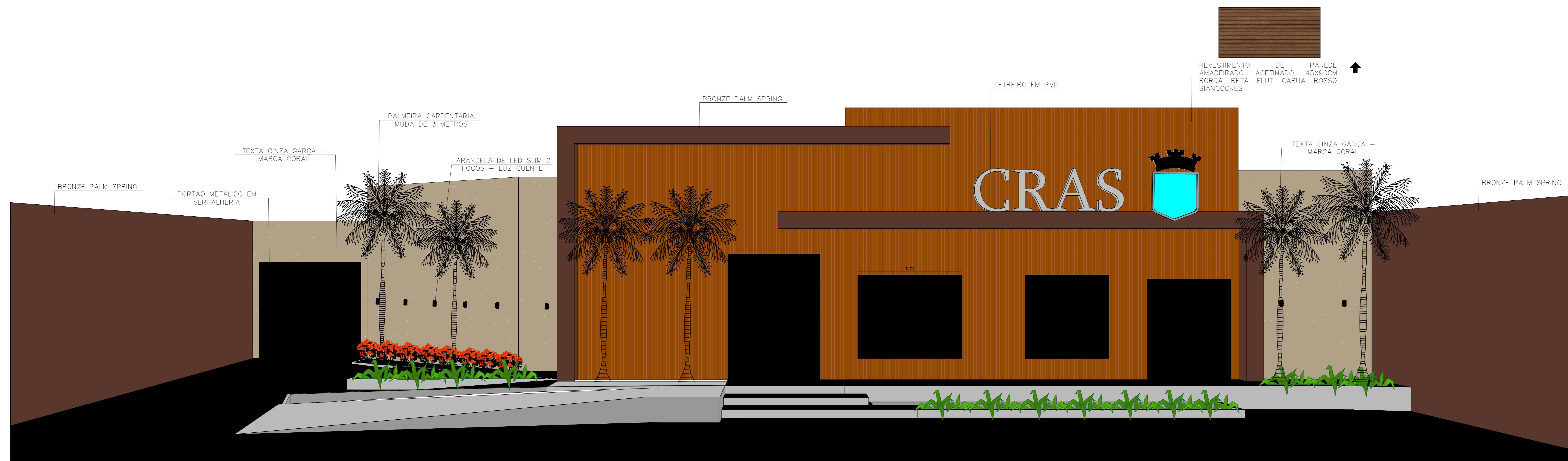
FACHADA FRONTAL ESCALA: 1/200