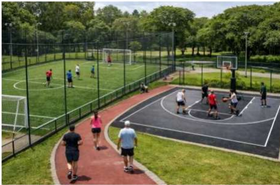
Programa de Aceleração do Crescimento (PAC)/Ministério do Esporte