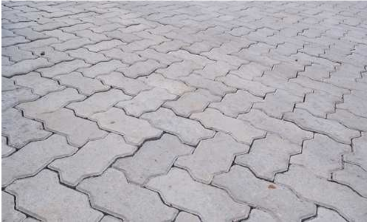
Imagem 1 - Referente de paginação

vibratória reversível com motor 4 tempos a gasolina, força centrífuga de 25 kn (2500 kgf), potência 5,5 cv.