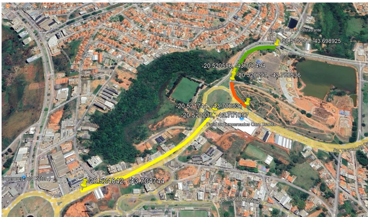
Figura 1 - Localização com coordenadas geográficas Google Earth (Início: -20.524842, -43.704744, Fim: -20.522039, -43.701097, Início: -20.521744, -43.700031, Fim: -20.520797, -43.700536, Início: -20.520556, -43.700494, Fim: -20.519214, -43.698925).

Os serviços serão executados no endereço de locação da obra no Município de Ouro Branco/MG, conforme elucidado ao longo deste projeto básico e indicação e coordenadas ilustradas a seguir: