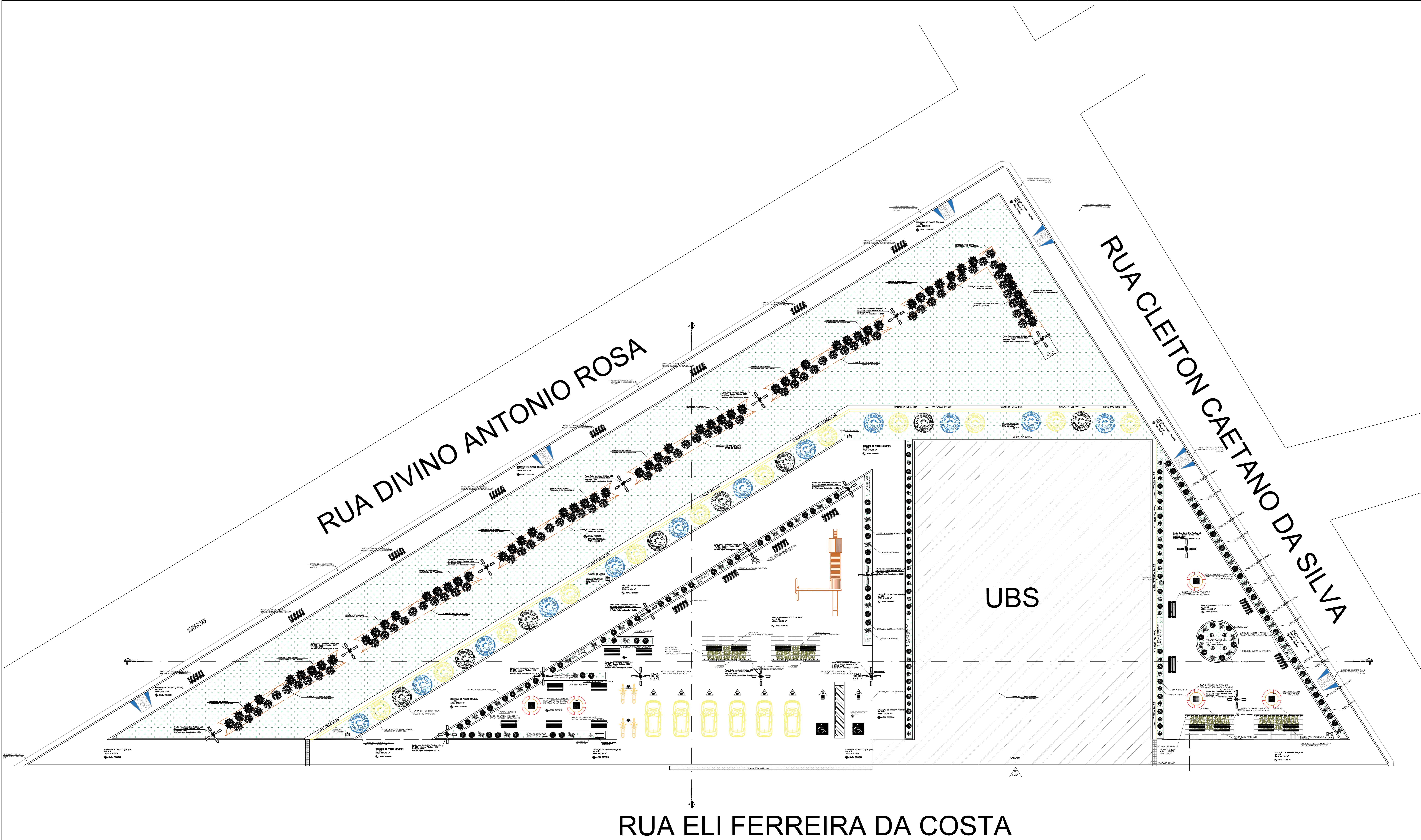
PLANTA BAIXA DE LAYOUT ESCALA: 1/125