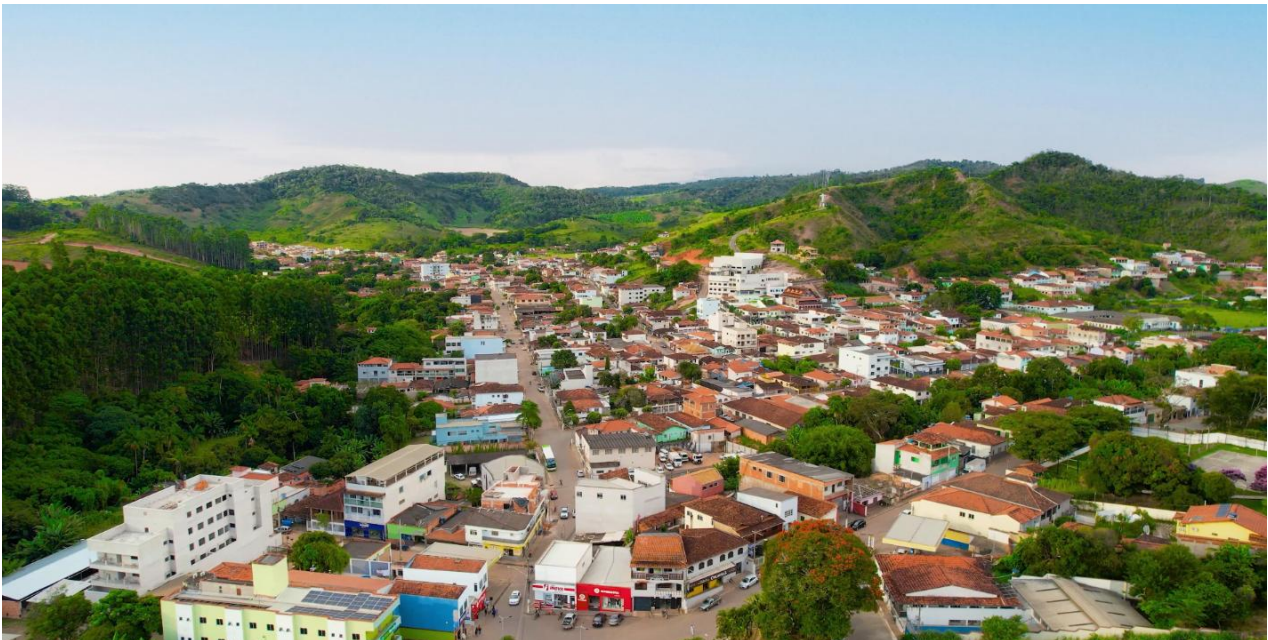
Figura 01 – Vista Panorâmica do município de Virginópolis

Em linhas gerais, Virginópolis está localizada dentro dos domínios Montanhosos e sua área urbana está assentada em um fundo de vale (Figura 3).