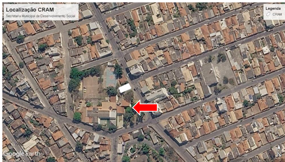
Figura 3 - Imagem de satélite da localização do CRAM.