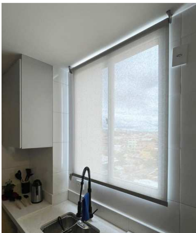
Figura 1- Imagem meramente ilustrativa de Cortinas Rolô – Tela Solar 3%.