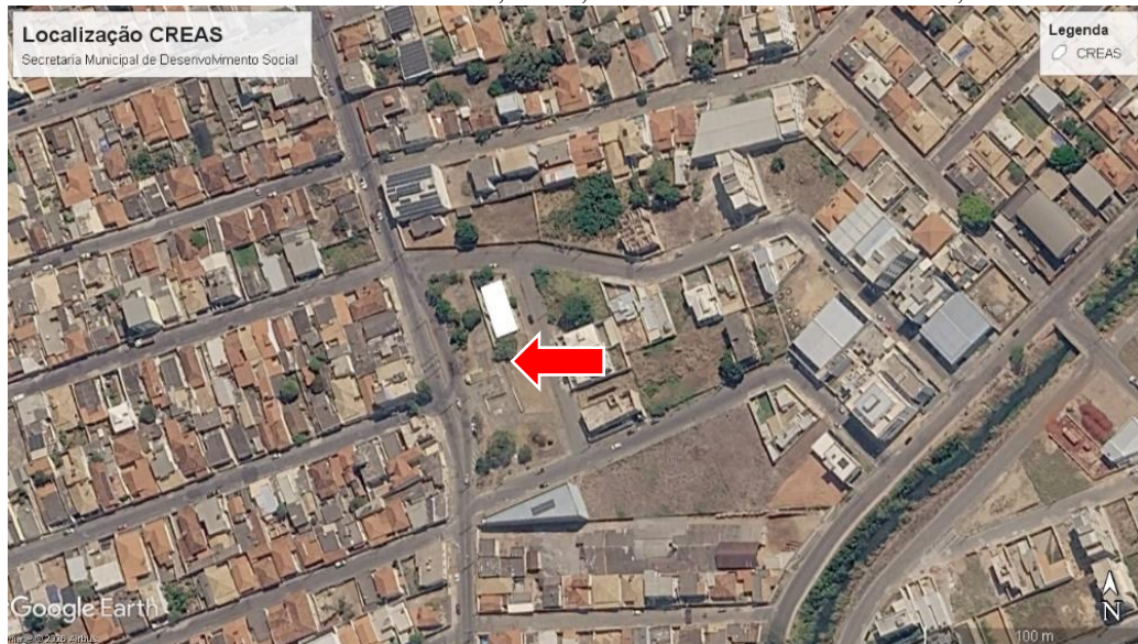
Figura 2 - Imagem de satélite da localização do CREAS.

Localizado na Rua José Lara de Oliveira, nº 20, bairro Lourdes - Itaúna/MG, CEP 35680-898.