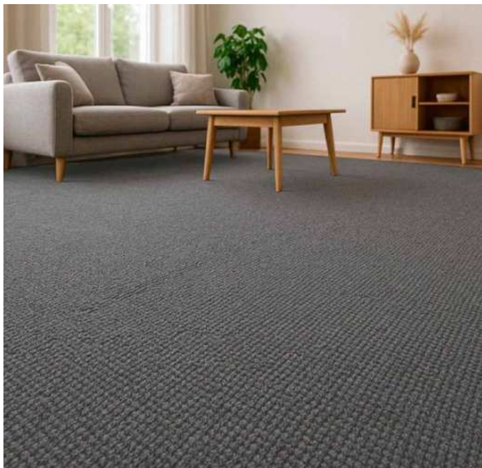
Figura 3- Imagem meramente ilustrativa de Carpetes Blouclé.