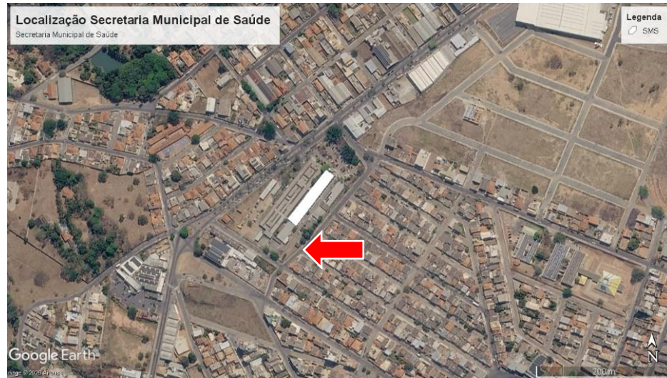
Figura 1- Imagem de satélite da localização da Secretaria Municipal de Saúde.