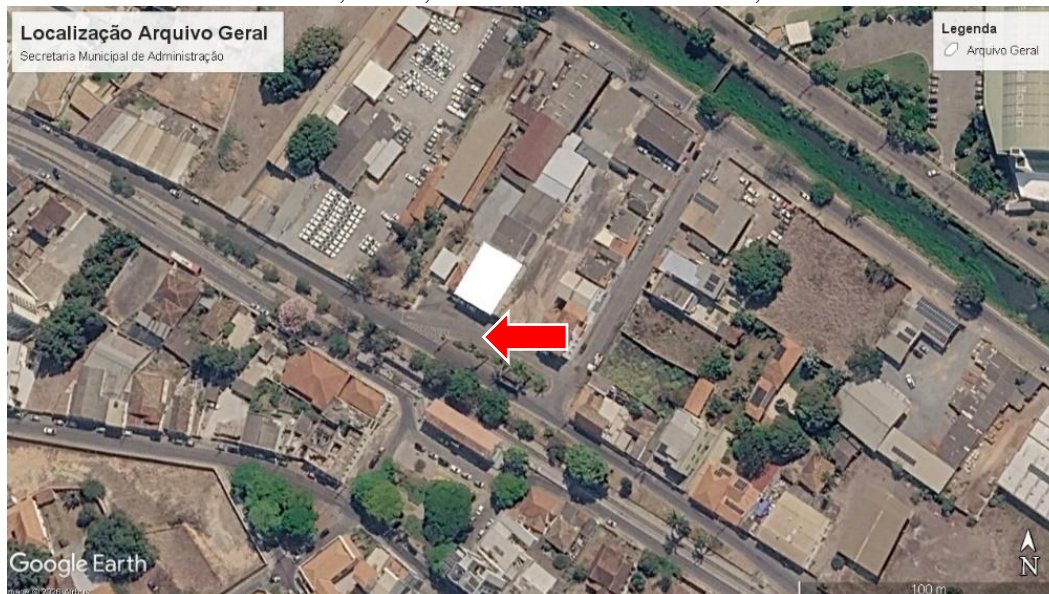
Figura 4 - Imagem de satélite da localização do Arquivo Geral.

Localizado na Rua Dona Cota, nº918, bairro Centro – Itaúna/MG, CEP 35680-033.