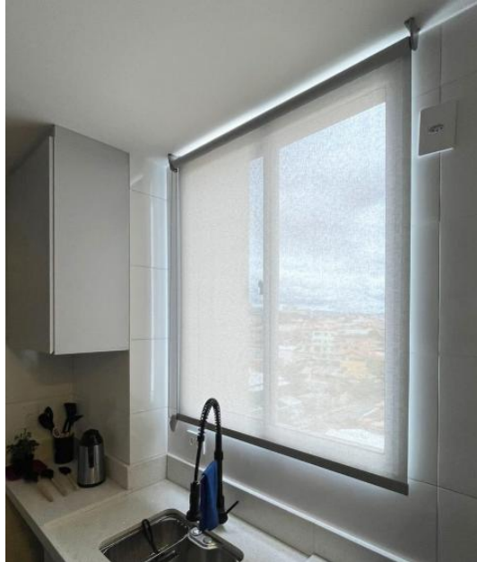
Figura 6- Imagem meramente ilustrativa de Cortinas Rolô – Tela Solar 3%.