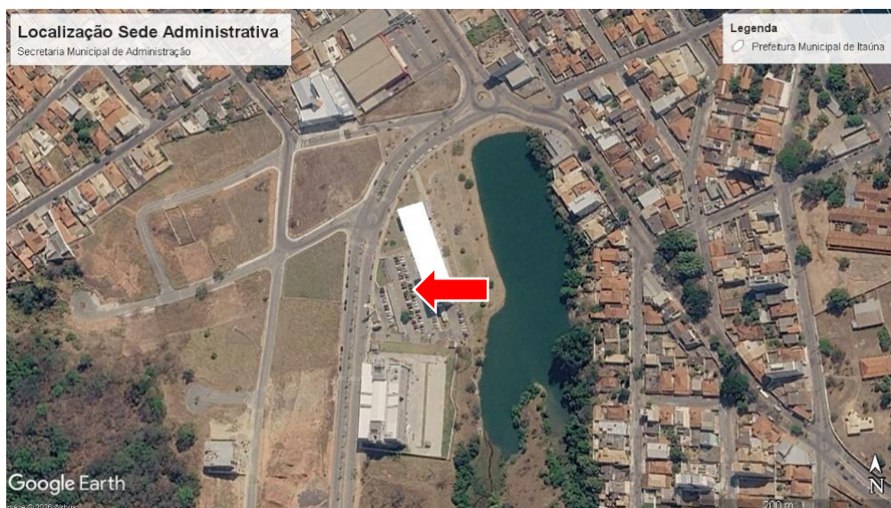
Figura 5 - Imagem de satélite da localização da Sede Administrativa.