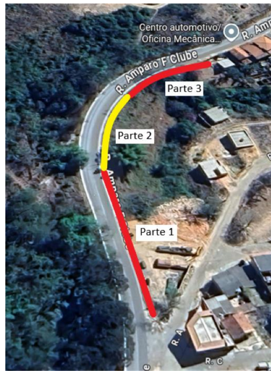
Figuras 5 e 6: Localização do trecho 3.