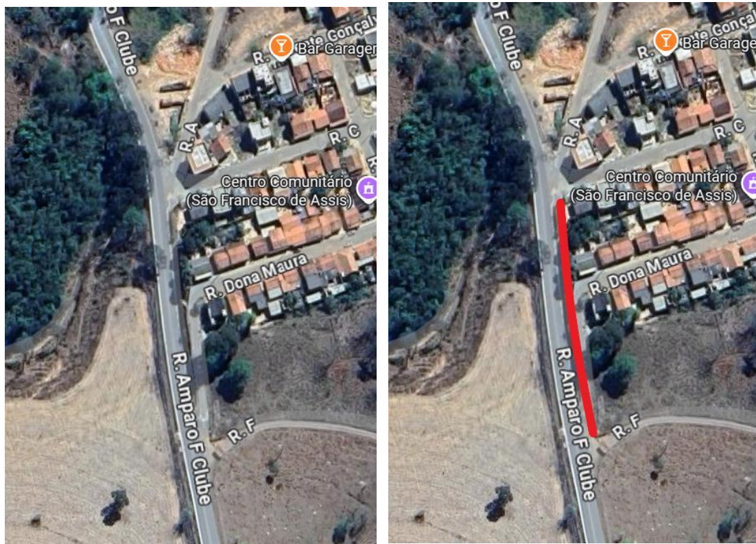
Figuras 3 e 4: Localização do trecho 2.

TRECHO 2: o trecho 2 possui 102 metros de extensão, será feito um passeio de concreto em local plano, com 1,20 metros de largura. Detalhe que teremos um pequeno muro de contenção entre o passeio e o talude, este muro será feito com bloco de concreto de 20cm de espessura cheio de concreto e com armação de vergalhão de aço espessura de 8mm, armados a cada 2 metros, com canaleta na base e viga no topo do muro.