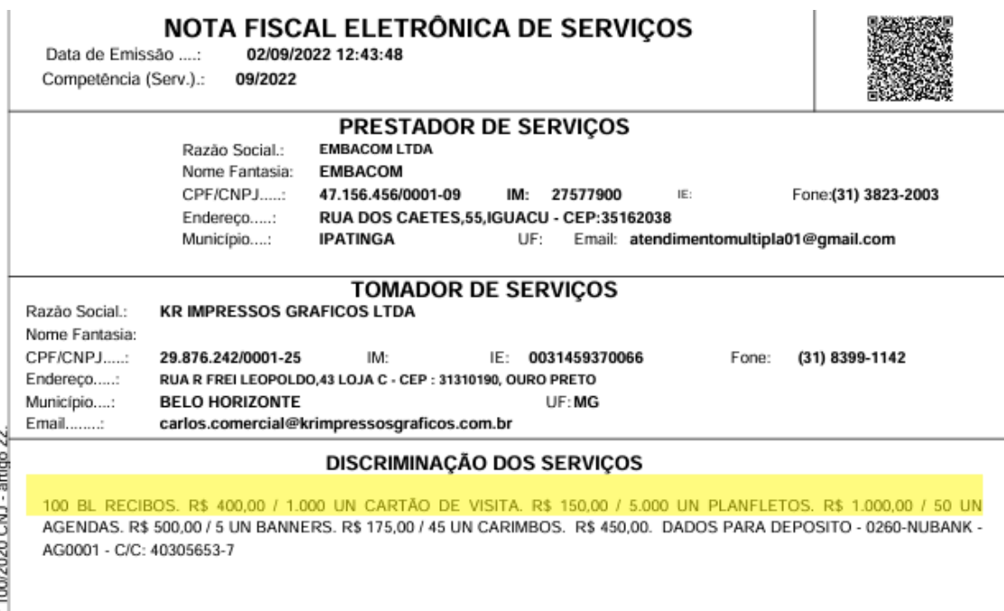
Imagem 04_Retirada da documentação encaminhada pela RECORRIDA