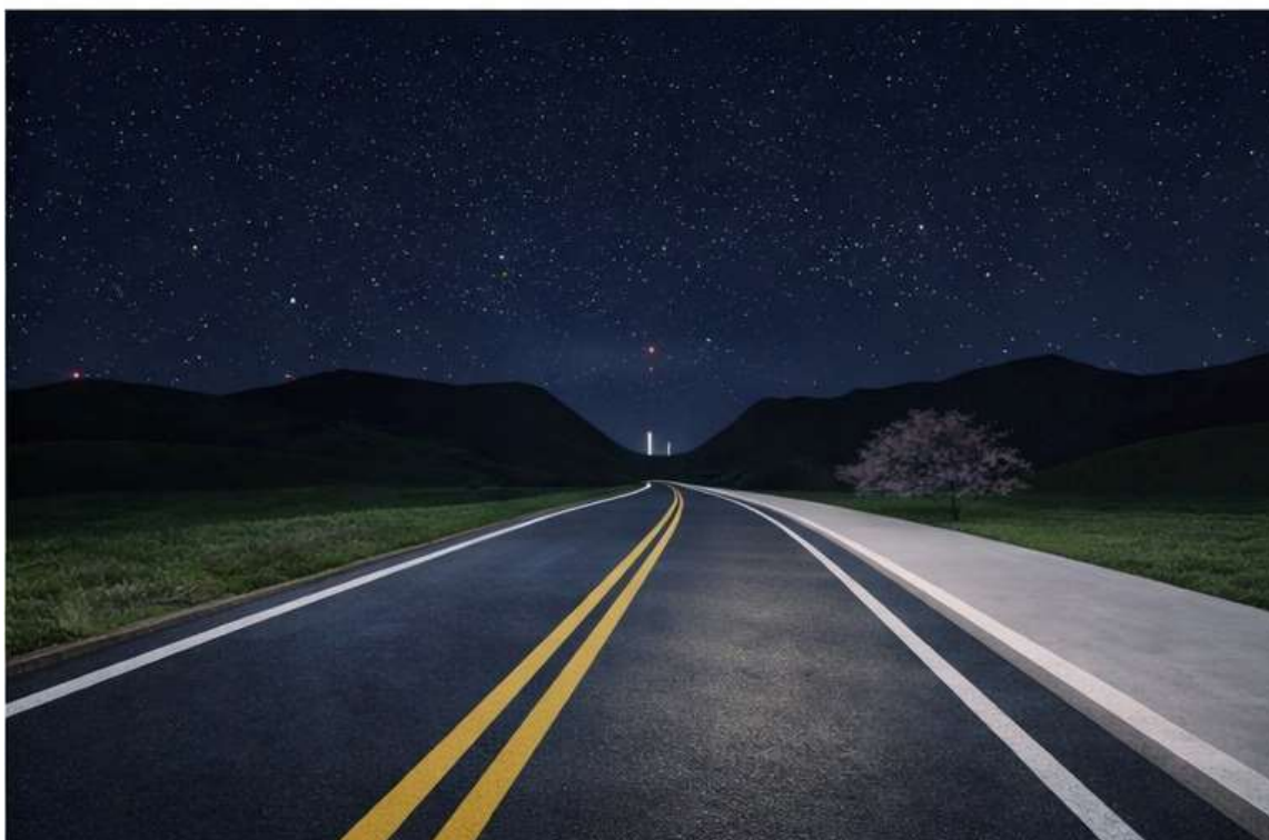
Figura 2 – PISTA DE CAMINHADA

Estado de Minas Gerais CNPJ: 18.385.104/0001-27