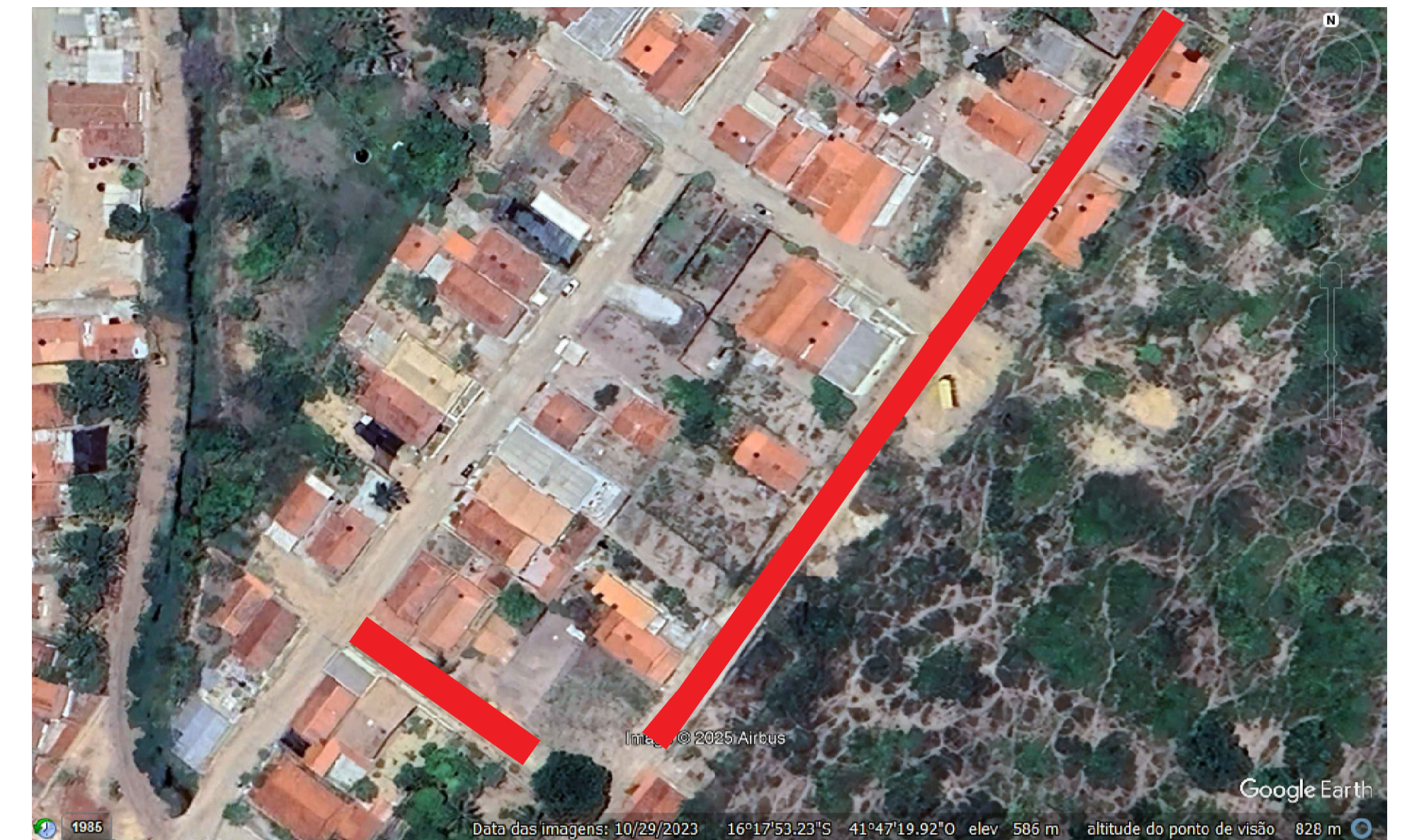
Imagem 01 - Localização do empreendimento - Rua Olegário Cardoso de Oliveira e Rua Ernesto Che Guevara- Comercinho/MG