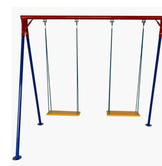
BALANÇO DE FERRO DUPLA, COM TUBO DE AÇO, CADEIRINHA EM MADEIRA DE LEI, CORRENTES GALVANIZADAS E FIXADORES "CASTANHAS" PARA QUE NÃO HAJA DESGASTE NOS ELOS DAS CORRENTES. PINTURA: ESMALTE INDUSTRIAL E FUNDO ANTI-CORROSIVO.