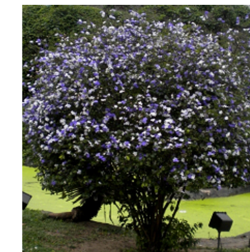
- MANACÁ DE JARDIM