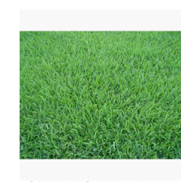
- GRAMA ESMERALDA