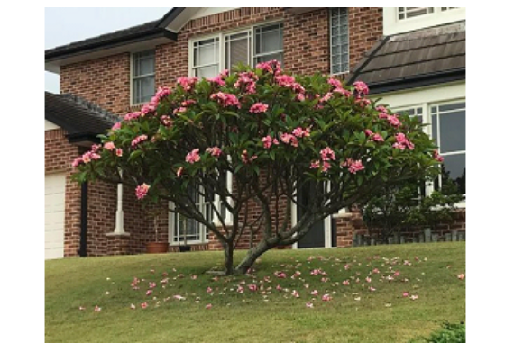
- JASMIM MANGA