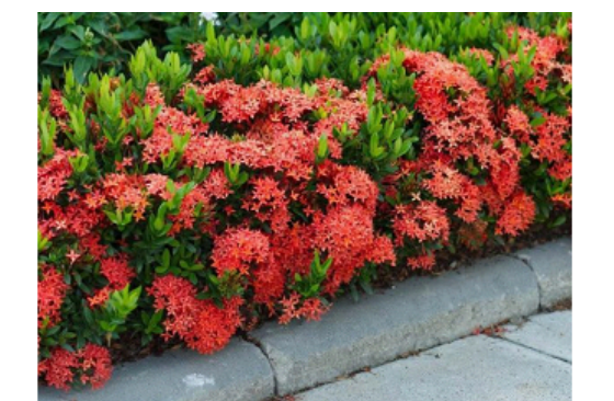
- IXORA VERMELHA