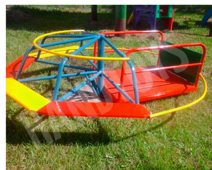
GIRA - GIRA ACESSÍVEL DE FERRO COM ASSENTO EM MADEIRA TRATADA 5 ASSENTOS, SENDO QUE UM É ACESSÍVEL