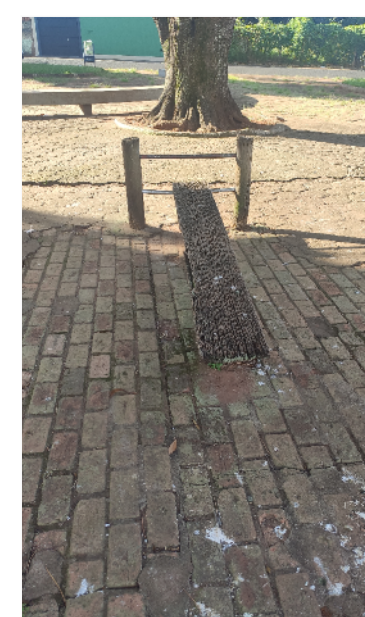
- PRANCHA ABDOMINAL DEGRADADA