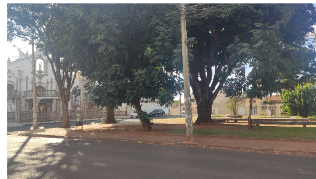
- FOTO DA PRAÇA A SER REFORMADA