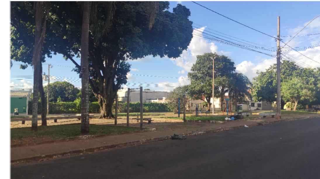
- FOTO DA PRAÇA A SER REFORMADA