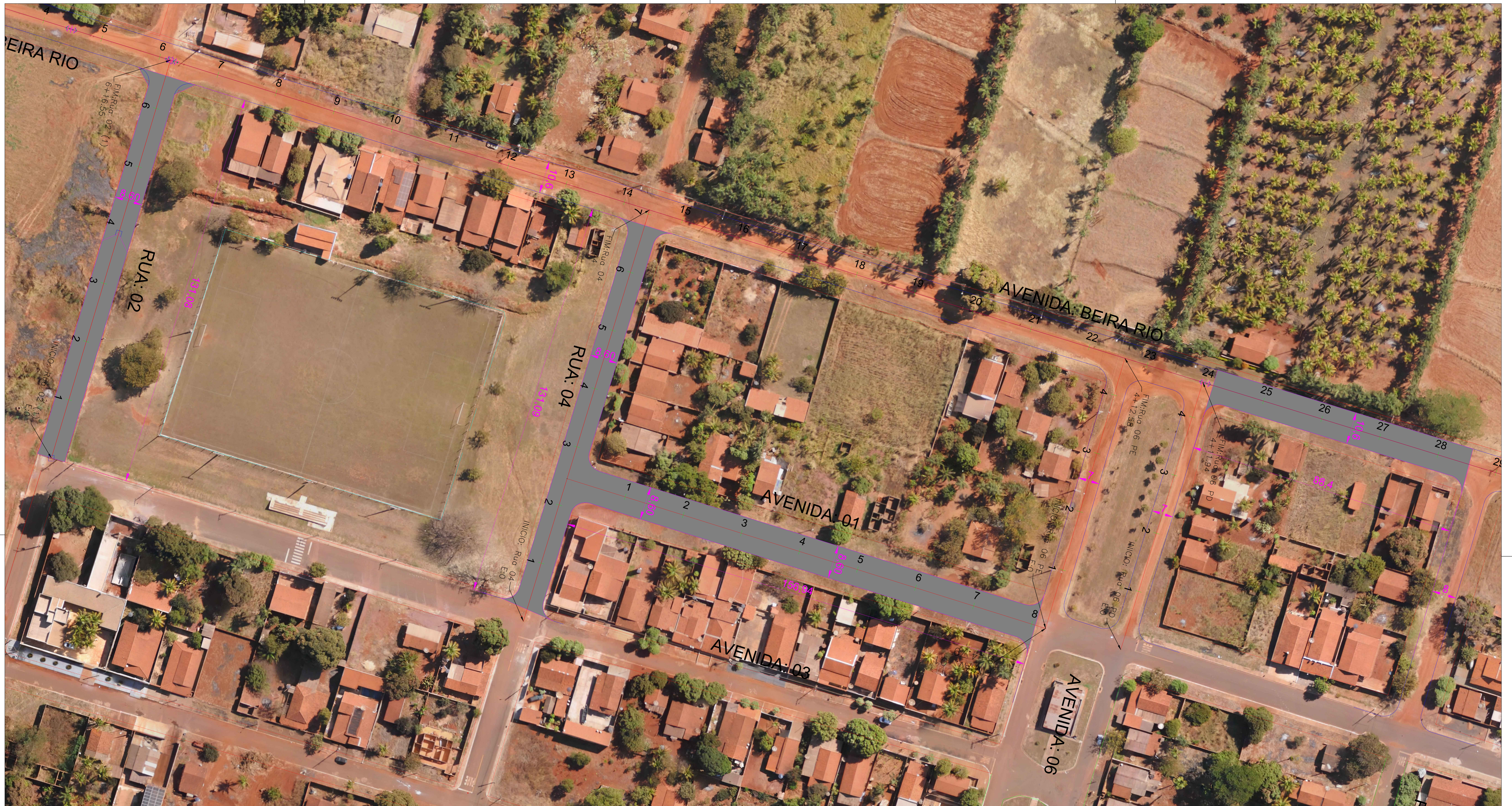
SEÇÃO TIPO DE PAVIMENTAÇÃO LADO ESQUERDO PISTA AVENIDA BEIRA RIO ESCALA: 1:75