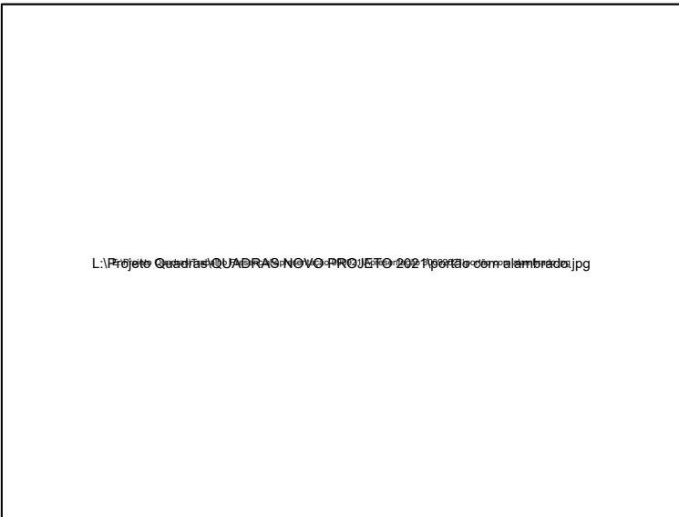
Detalhe do portão P6 s/escala