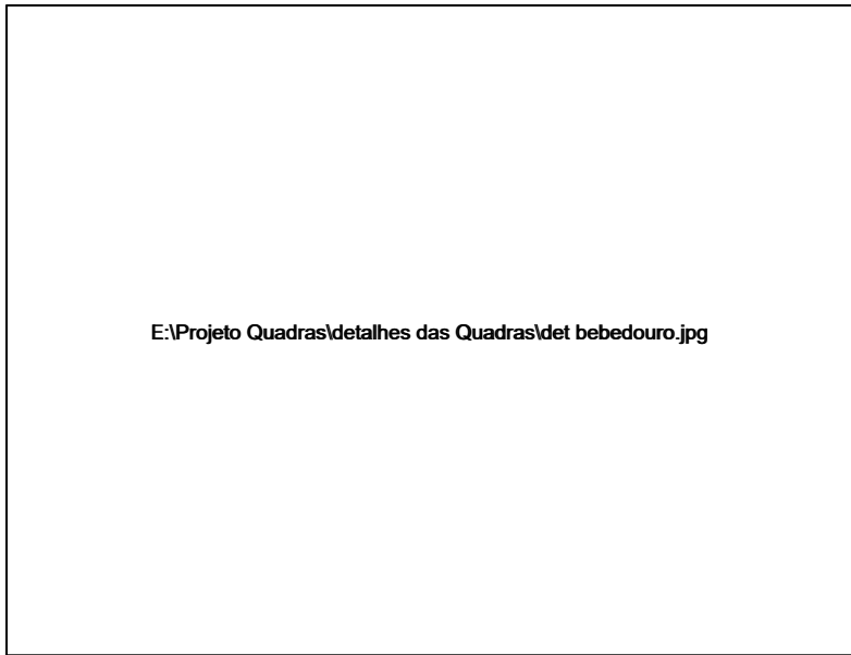
Detalhe do Bebedouro s/escala