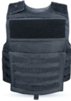
Figura 2: Imagem de referência da capa Tática Molle