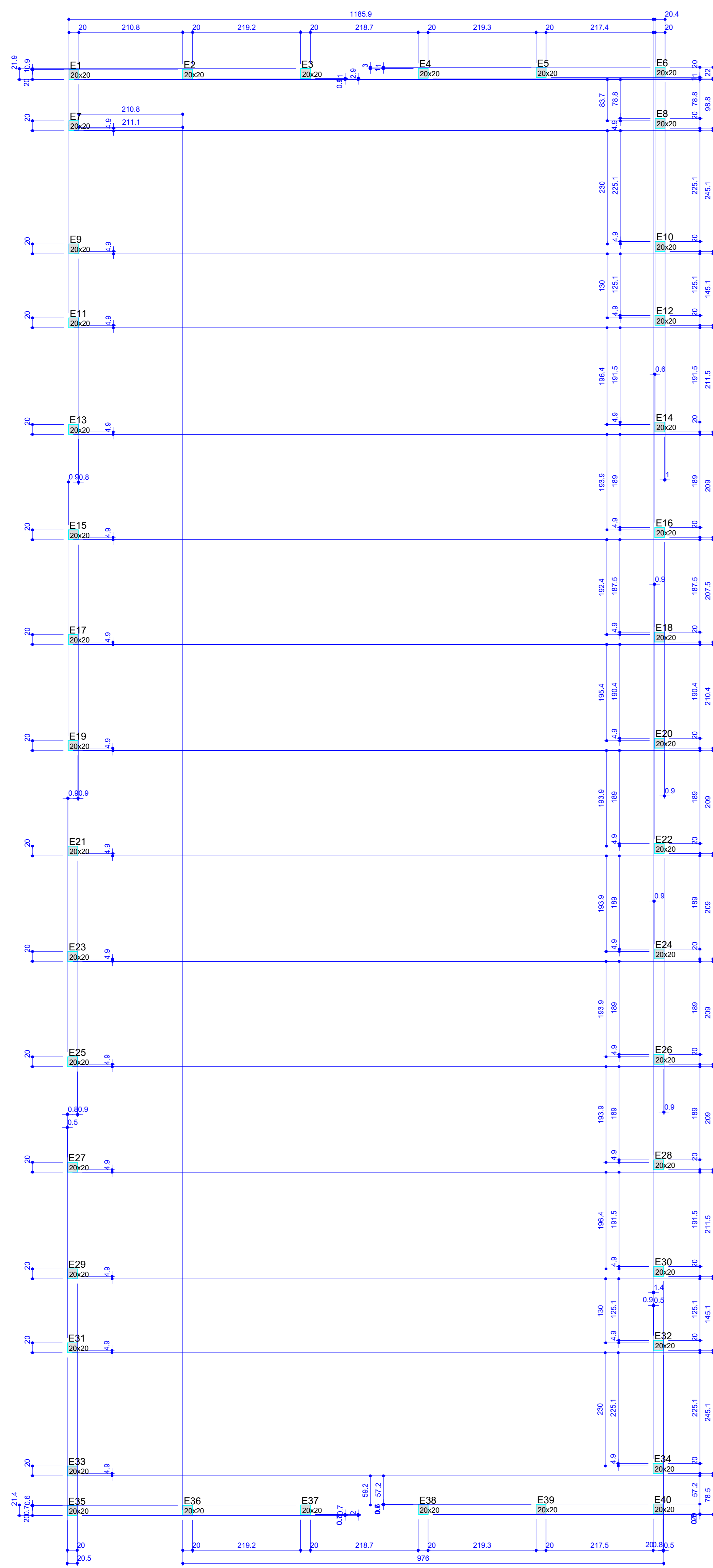
Forma do RESPALDO (Nível 50) escala 1:50