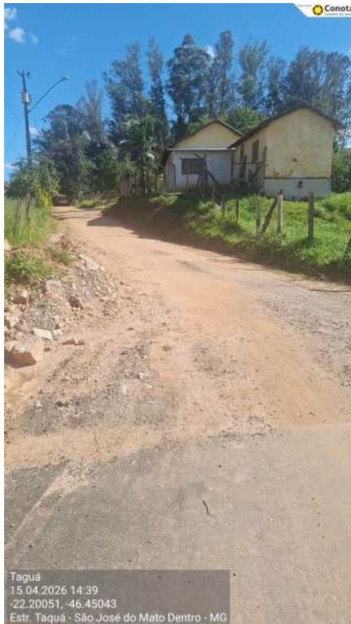
Vista 2 – trecho a ser asfaltado – Posto da saúde e Associação dos moradores do bairro Taguá – Etapa 1