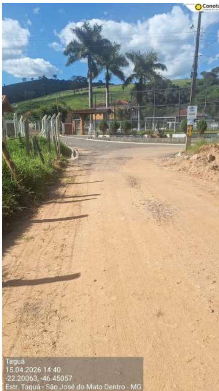
Vista 1 - Trecho a ser asfaltado - Etapa 1

Abaixo, seguem fotos da extensão da Estrada Vicinal do Bairro Taguá – Zona Rural