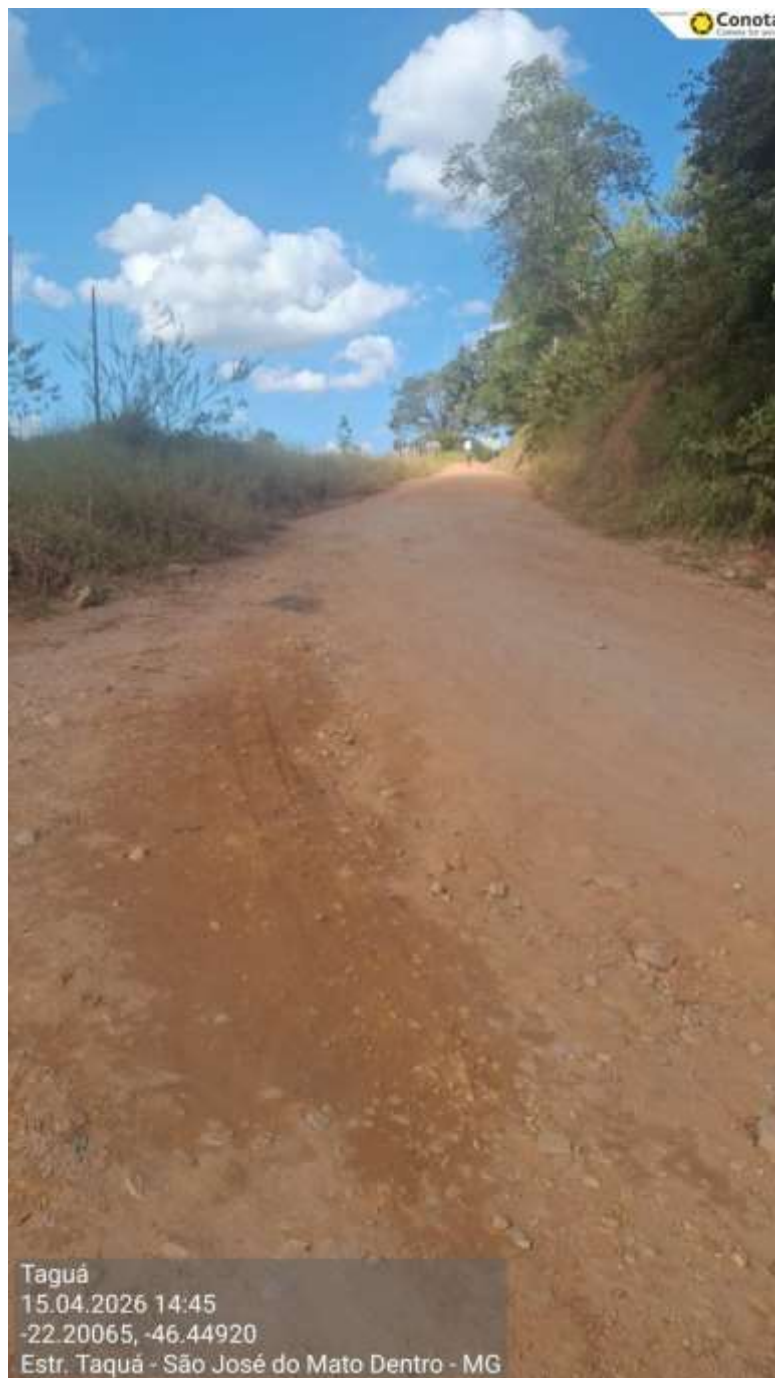
Vista 4 – trecho a ser asfaltado – Etapa 2