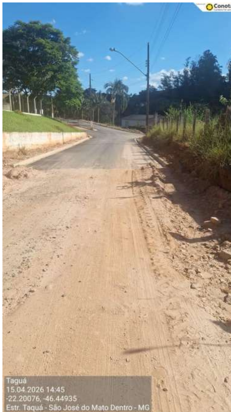
Vista 3 – trecho a ser asfaltado – Etapa 2