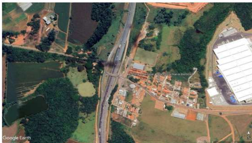
Figura 1-1 – Localização da E.M. Professora Maria Barbosa