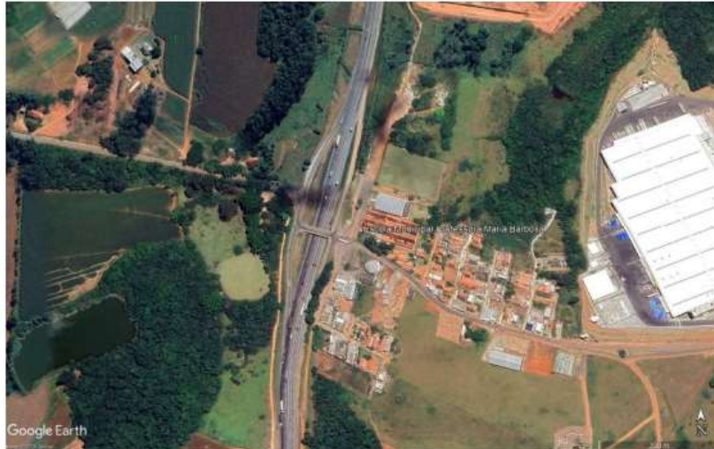
Figura 1-1 – Localização da E.M. Professora Maria Barbosa