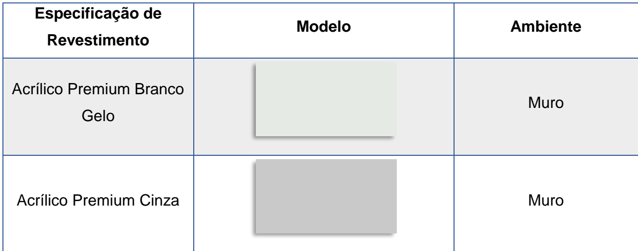
Tabela 12-1 – Resumo de Pinturas