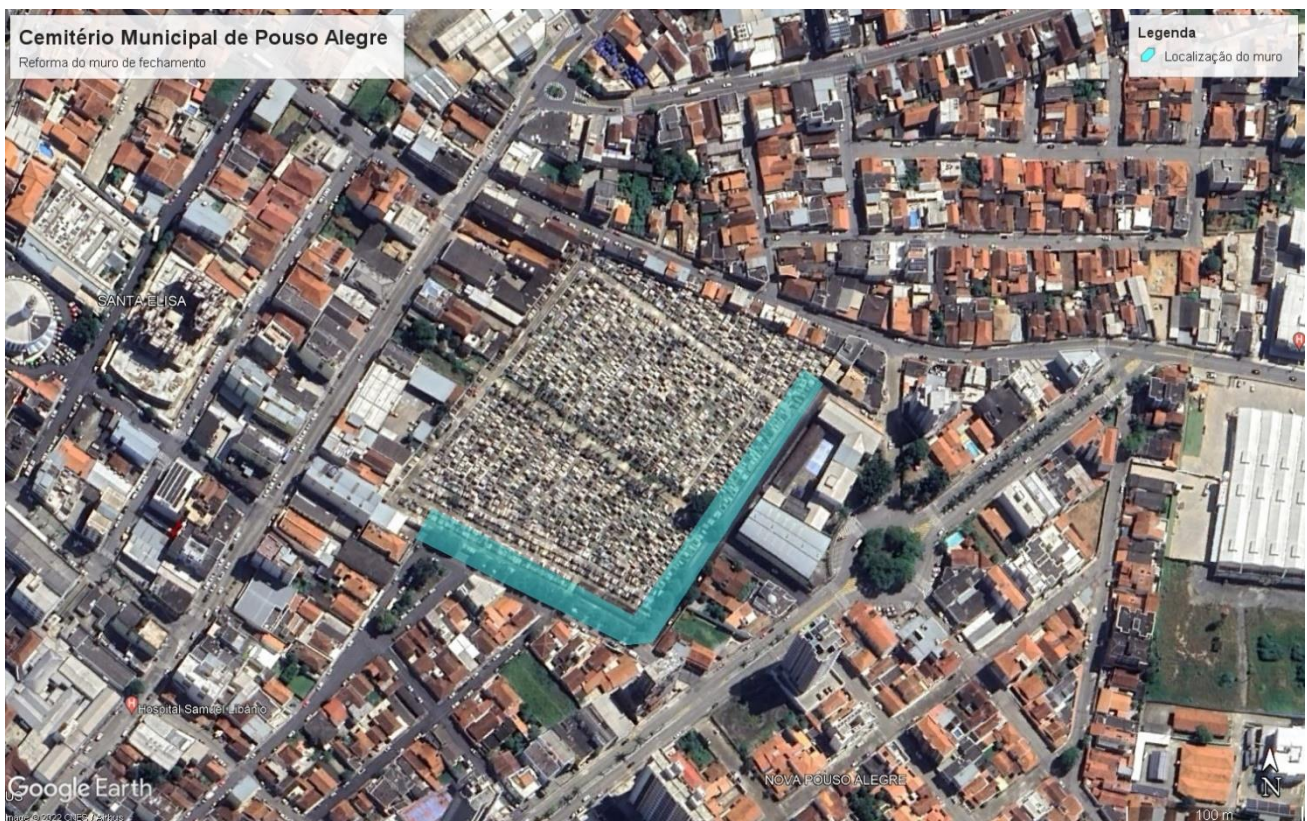
Figura 1 - Localização do Muro

O presente documento tem como finalidade apresentar o projeto executivo da Reforma do Muro de Fechamento do Cemitério Municipal, a ser implementado na Rua Comendador José Garcia, 1076, Bairro Santa Elisa, Pouso Alegre - MG. A obra terá como função principal a demolição e construção de um muro novo e, em um trecho específico, a construção de um muro de divisa com a estrutura existente, que não pode ser demolida. A localização do muro é apresentada na Figura 1.