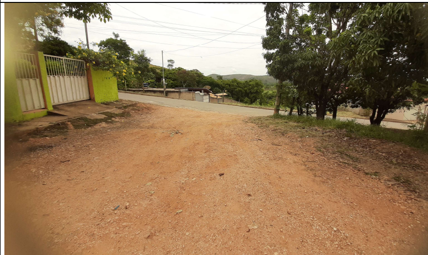
Descrição: Rua Antônio Leandro Filho com Rua Valério Sales Costa S.