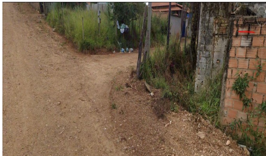
Descrição: Rua Santa Clara, esquina com Rua Antônio Leandro