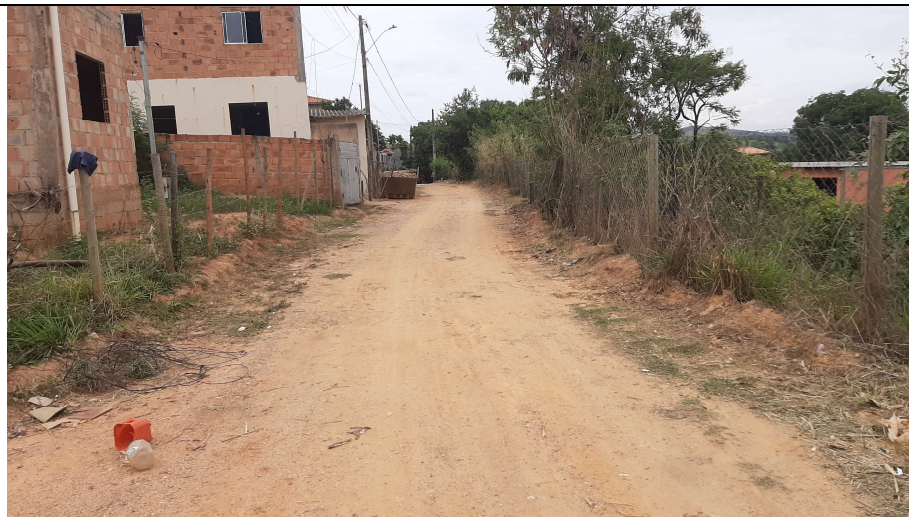
Descrição: Rua Antônio Leandro Filho