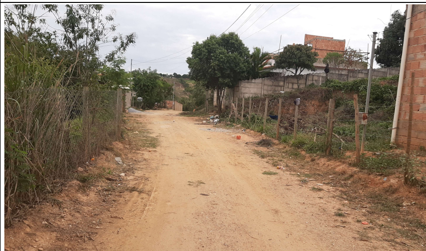
Descrição: Rua Antônio Leandro Filho com Rua Valério Sales Costa S.