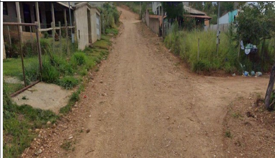
Descrição: Rua Antônio Leandro Filho e entrada da Rua Santa Clara