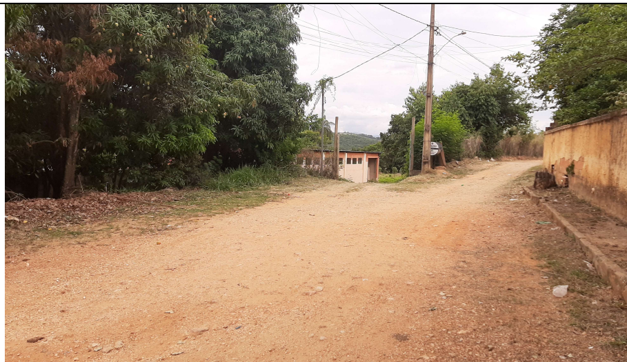
Descrição: Rua Antônio Leandro Filho