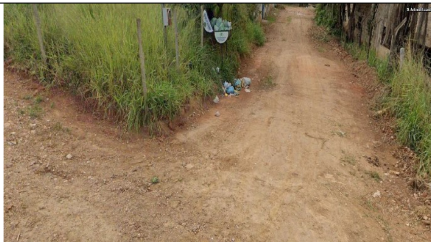
Descrição: Rua Santa Clara