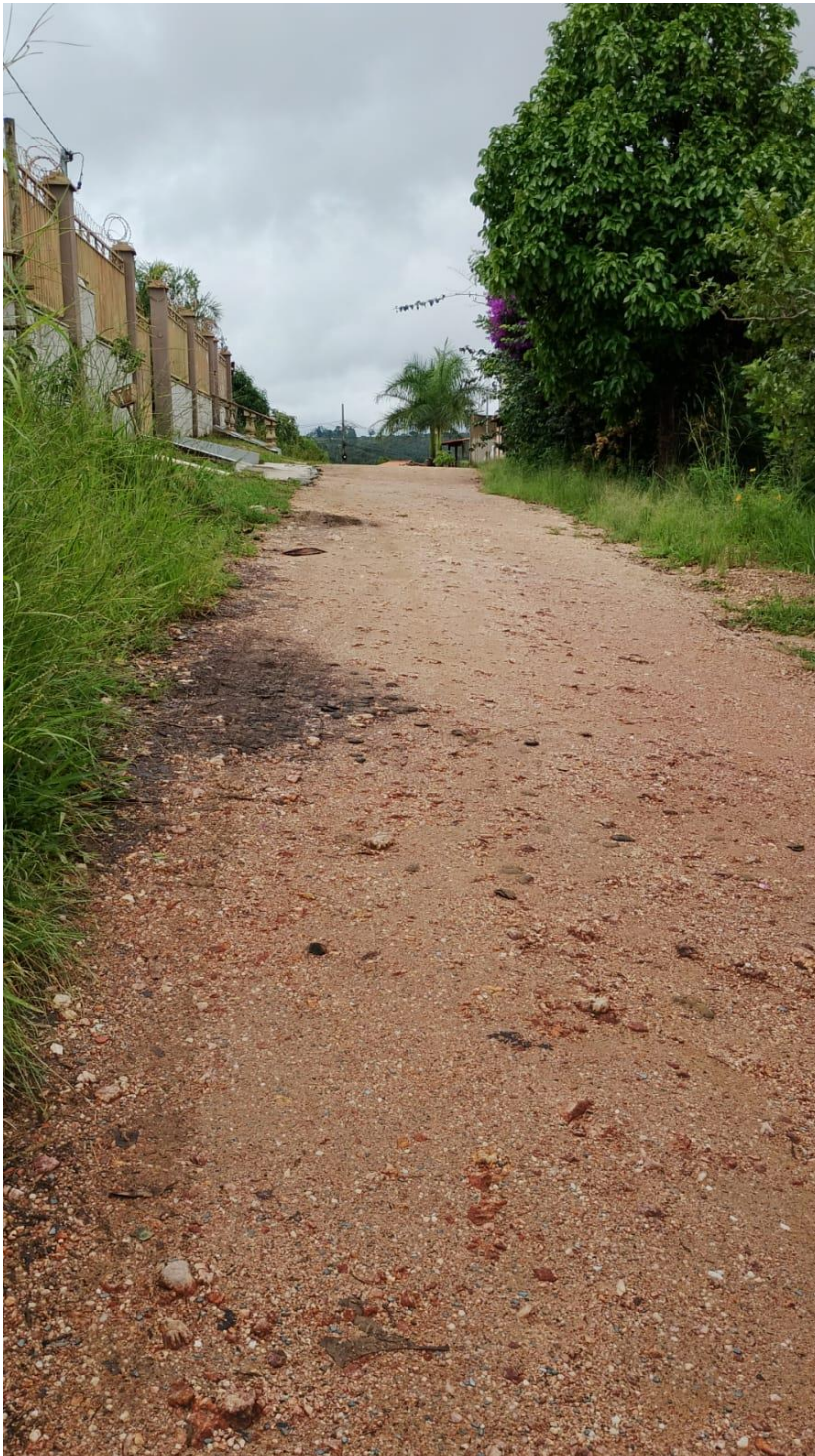
FIGURA 3. RUA FRANCISCO TEXEIRA LOMBA meio da via.

Tel. (31) 3683-1021 - CNPJ: 18.715.417/0001-04