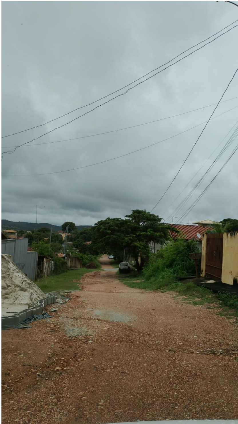
FIGURA 2. RUA FRANCISCO TEXEIRA LOMBA meio da via .

Tel. (31) 3683-1021 - CNPJ: 18.715.417/0001-04