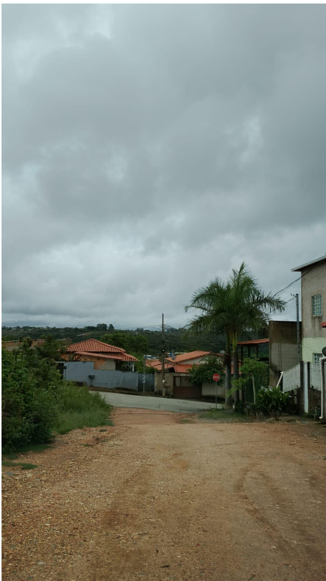
FIGURA 4. RUA FRANCISCO TEXEIRA LOMBA final do trecho esquina com a Rua Dona Branca.

Tel. (31) 3683-1021 - CNPJ: 18.715.417/0001-04