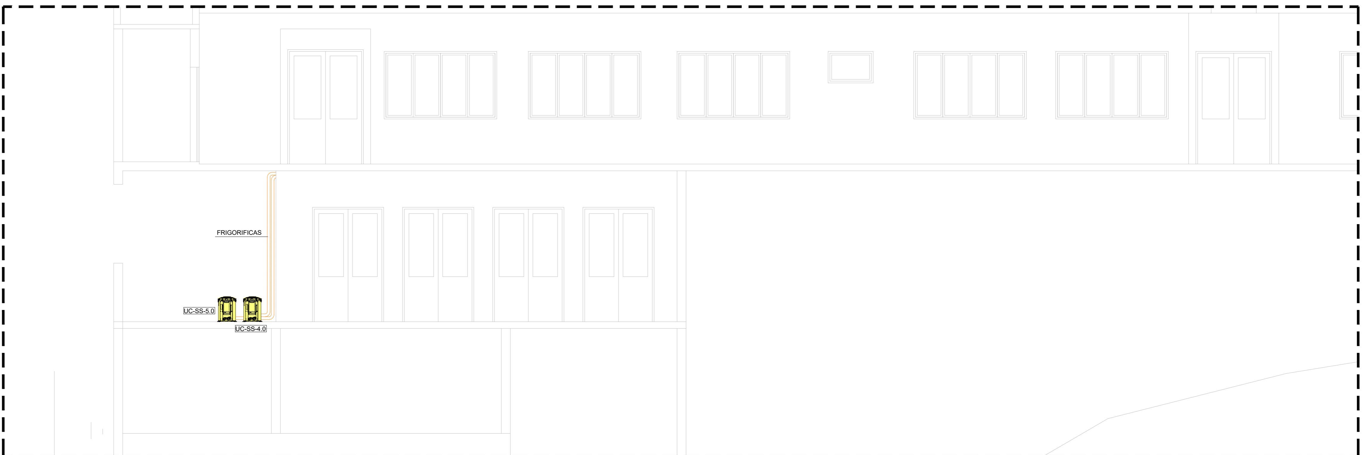
CORTE BB - ARANJO MECÂNICO ESC: 1/50