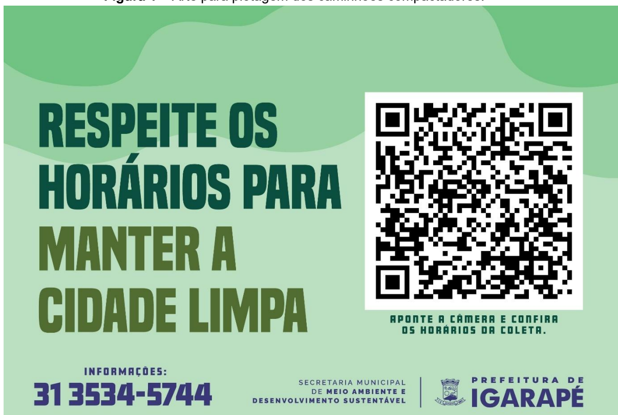
Figura 1 – Arte para plotagem dos caminhões compactadores.