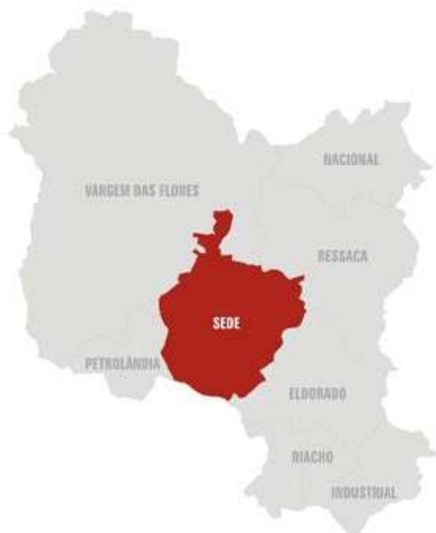
FIGURA 01: Regional Sede do Município de Contagem

A área de abrangência do objeto deste documento está localizada na Regional Administrativa Sede do Município de Contagem e compreende as Zonas de Especial Interesse Social, ZEIS2 Loteamento Público Funcionários e ZEIS1 Vila Funcionários.