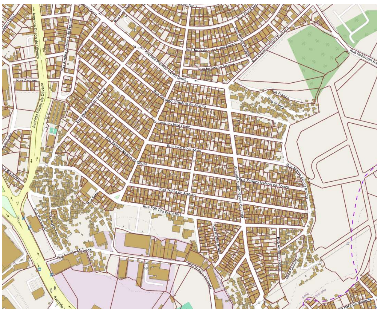
FIGURA 06: Base cadastral com edificações – Loteamento Público e Vila Funcionários