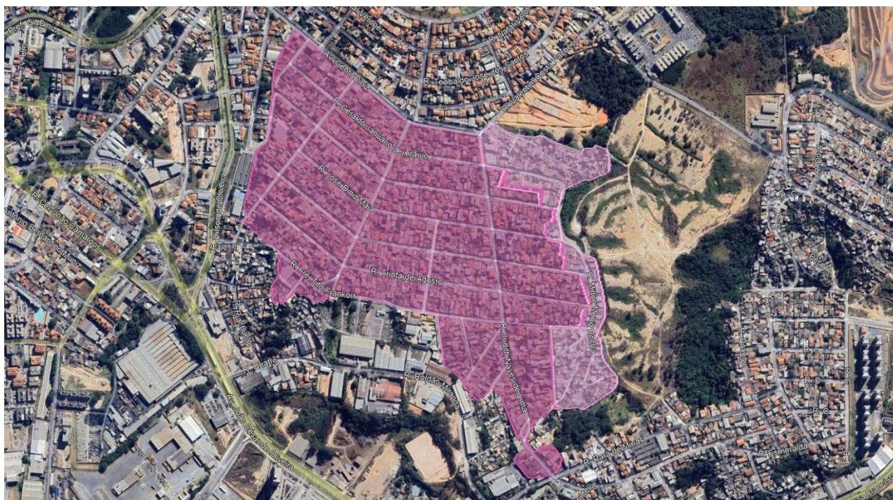
FIGURA 02: Loteamento Público e Vila Funcionários

FONTE: Google Earth, 2024. Poligonais fornecidas pela SAI|SDH.