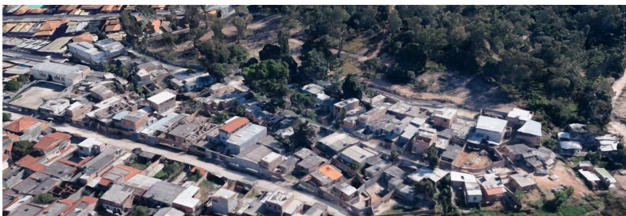
FIGURA 04: Imagem de Satélite com edificações 3D – Porção norte da Vila Funcionários

Seu sistema viário é composto por vias de características heterogêneas entre si. De maneira geral, as vias localizadas nas porções sul e central da vila possuem pavimentação asfáltica, sarjetas e meio-fio. Já as vias situadas no extremo norte do assentamento não são pavimentadas e não possuem dispositivos de drenagem ou meio-fio. Nessas últimas, está atualmente em execução a implantação de rede oficial de abastecimento de água, pela Copasa. Intenciona-se que futuramente seja também implantada a rede de esgotamento sanitário oficial.