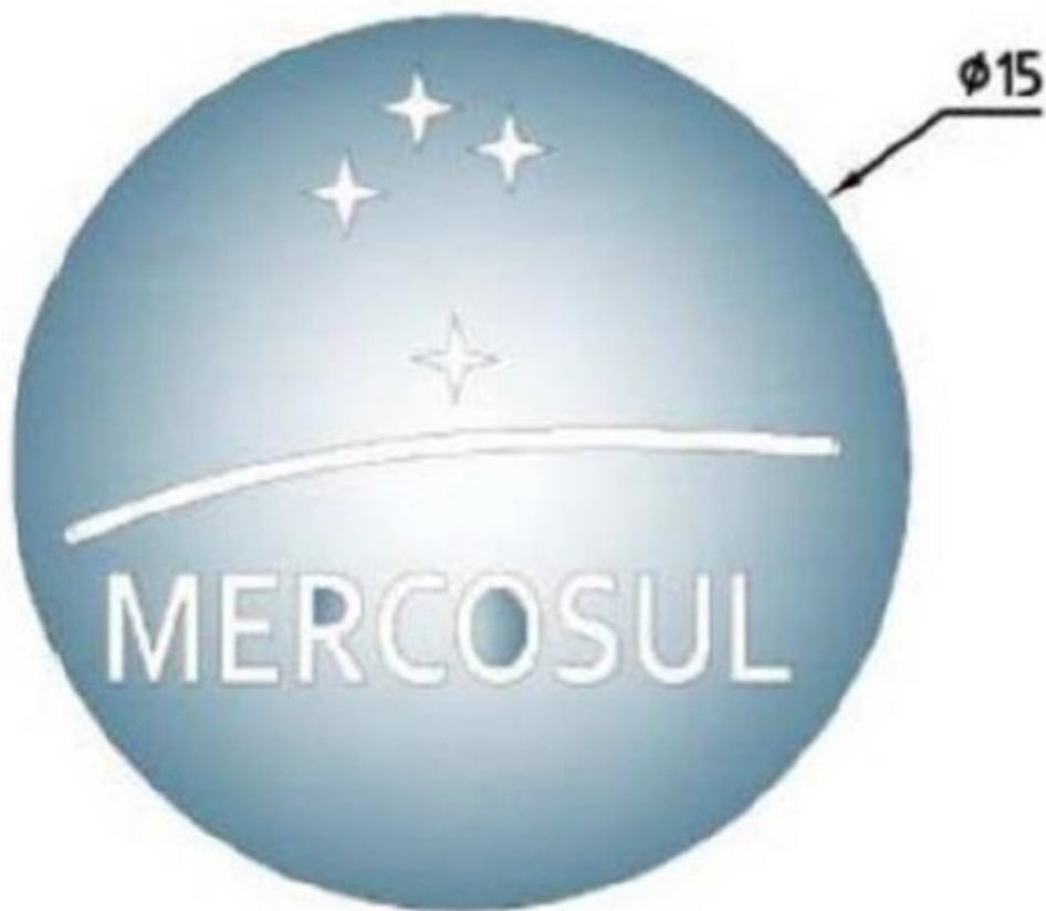
FIGURA IV - PADRÃO DAS INSCRIÇÕES SOBRE OS CARACTERES DA PIV