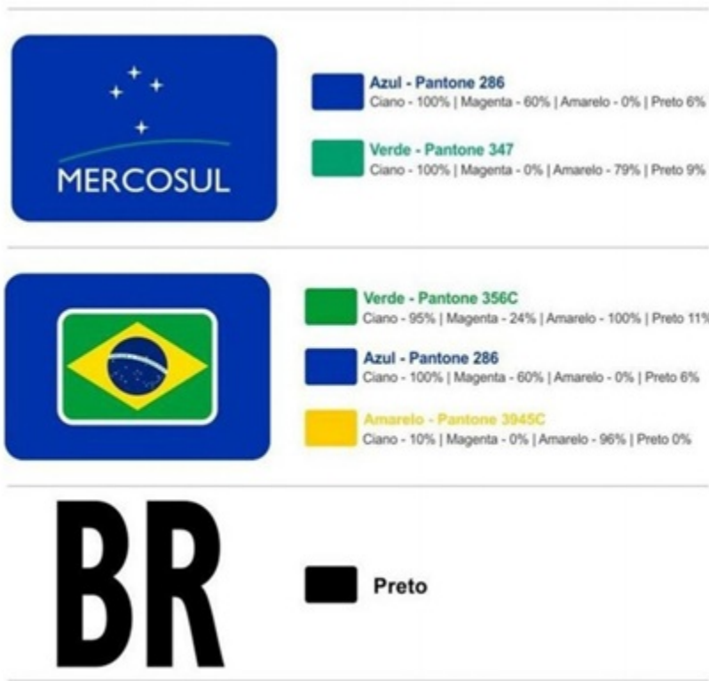
FIGURA III – MARCAS D’AGUA DE SEGURANÇA DA PELÍCULA RETRORREFLETIVA