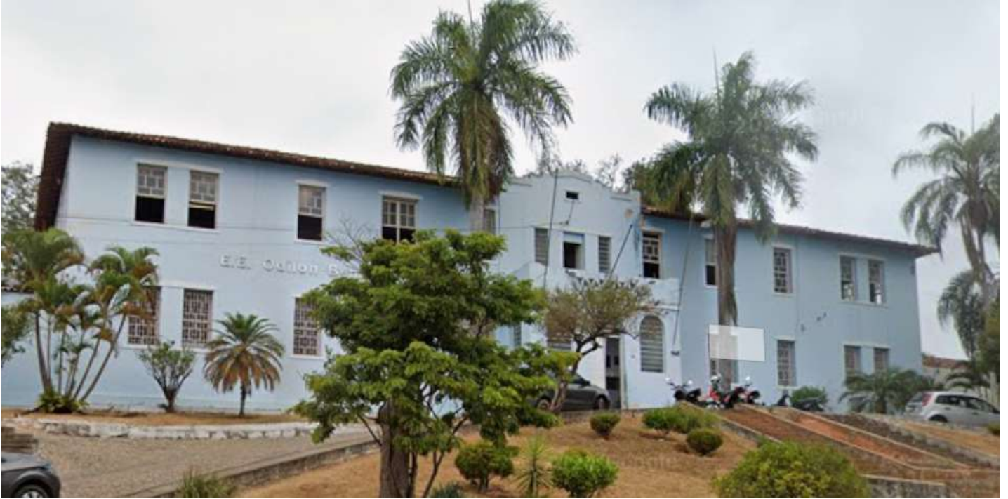
FACHADA - 2025