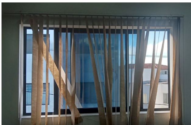
Foto das Persianas "antigas" que atualmente estão instaladas nos Setores da SRE-Diamantina, nas quais deverão ser retidas, pela empresa contratante, e entregue para a Diretoria Administrativa e Financeira da SRE-Diamantina. No local onde estão afixadas as persianas "antigas", serão instaladas às novas, conforme descrições, especificações e quantitativos elencados no subitem 1.1 deste Termo de Referência.

1.2. Conforme evidenciado na planilha, abaixo, de quantidades e medias das janelas, informamos que foram realizadas as aferições de Altura x Largura de cada janela, onde atualmente estão instaladas as Persianas "antigas" nas quais deverão ser retiradas, pela empresa contratada, e instaladas as novas Persianas tipo Rolo. Elencamos que foram acrescentados 20 (vinte) centimetro nas alturas e larguras de cada janela para obter uma dimensão abrangente das medidas das persianas correspondente à instalação. A empresa classificada e habilitada para a realização do serviço, deverá refazer todas as medidas para aferições necessárias das dimensões.