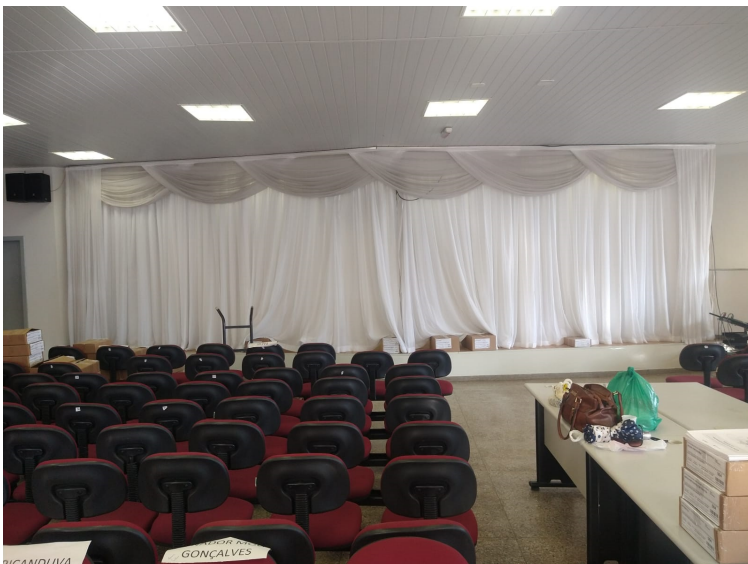
Foto da Cortina "antiga" que atualmente está instalada no Auditório da SRE-Diamantina, na qual deverá ser retirada, pela empresa contratante, e entregue para a Diretoria Administrativa e Financeira da SRE-Diamantina. No local onde está afixada a Cortina "antiga", será instalada à nova, conforme descrições, especificações e quantitativo elencado no subitem 1.1 deste Termo de Referência.