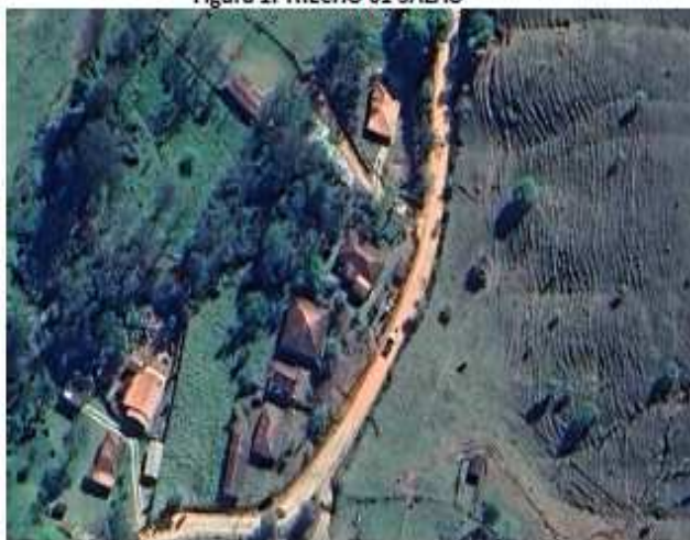
Figura 1. TRECHO 01 SALÃO

Os serviços devem seguir rigorosamente todo processo deste memorial e o projeto de cada uma das áreas. Toda e qualquer alteração ou adição de serviço deverá ser solicitada antes ao engenheiro responsável pela fiscalização da obra, para que posteriormente haja vistoria para analisar a necessidade da mesma.