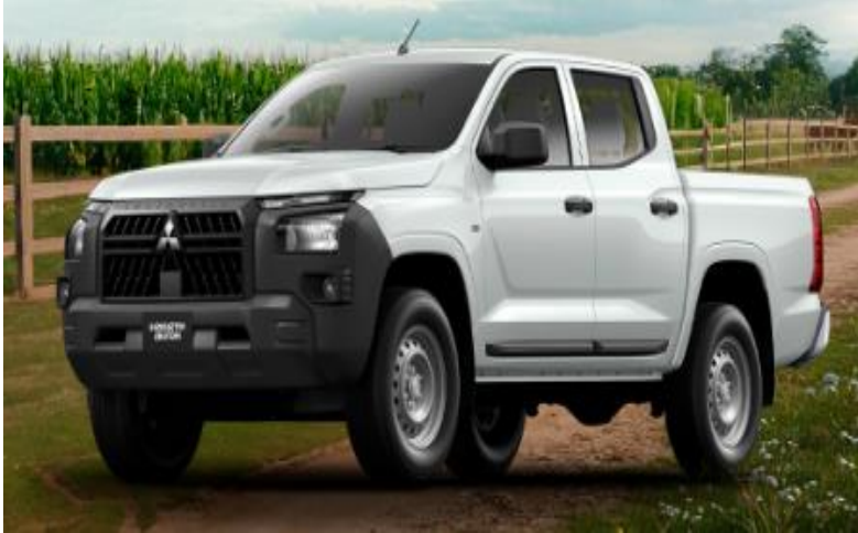
Veículo de utilizado de referência de qualidade