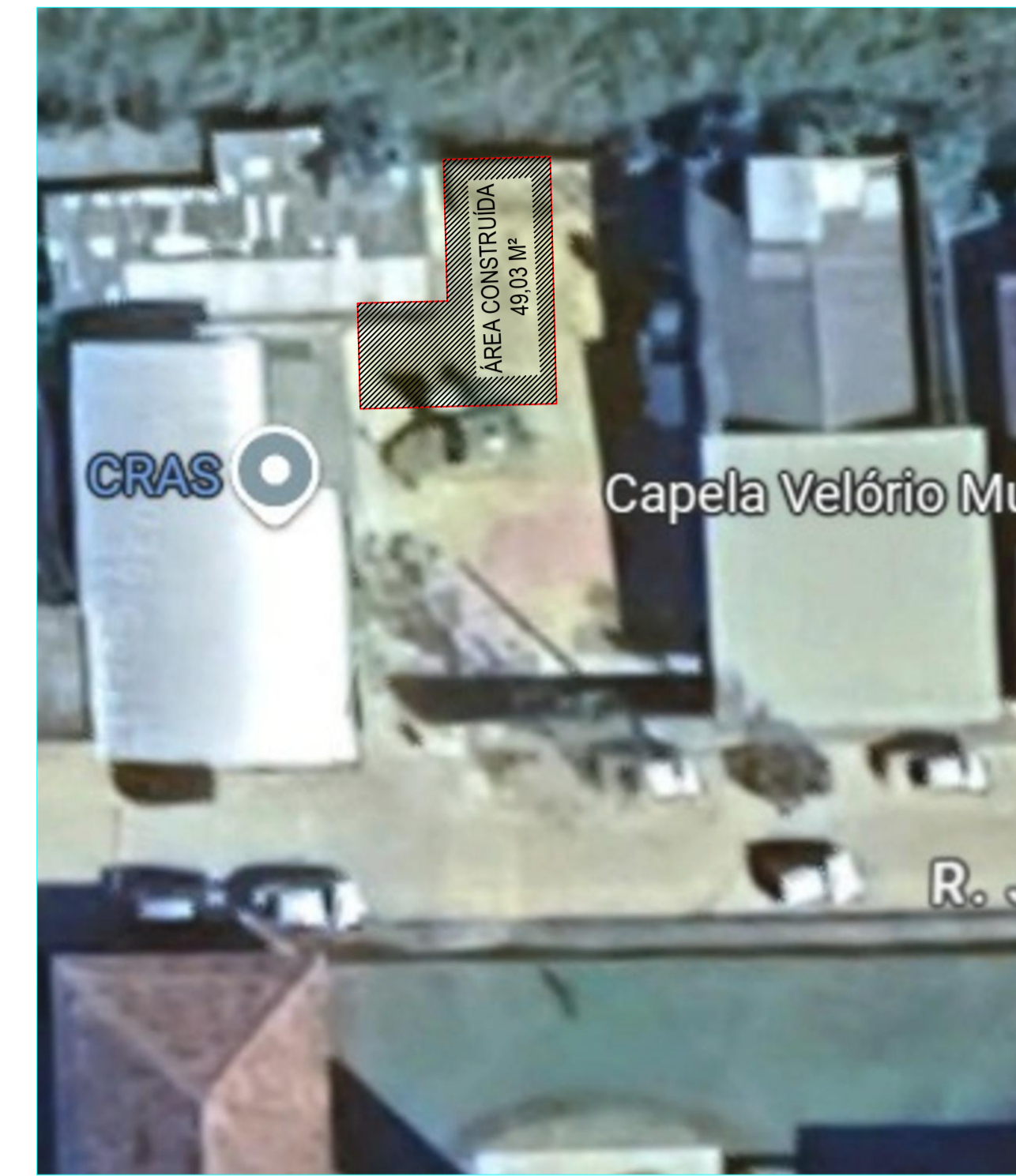
LOCALIZAÇÃO 20°28'5.04"S 42°29'9.26"O