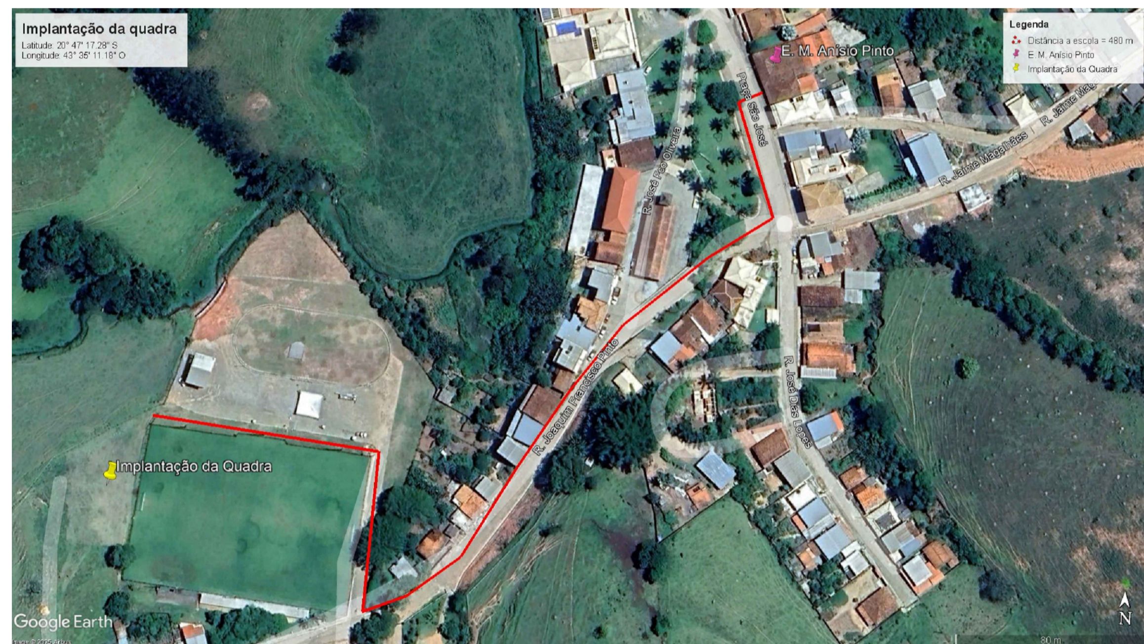
Distância da escola x quadra Sem escala

QUADRO DE ÁREA: ÁREA DO TERRENO: 1690,60 m 2