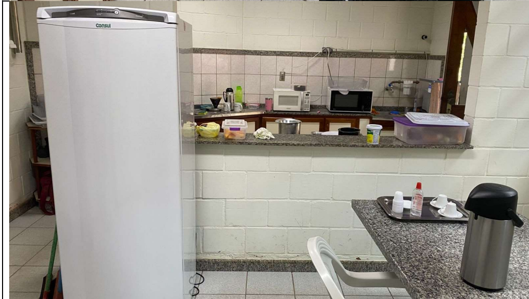
Imagens da cozinha do primeiro pavimento