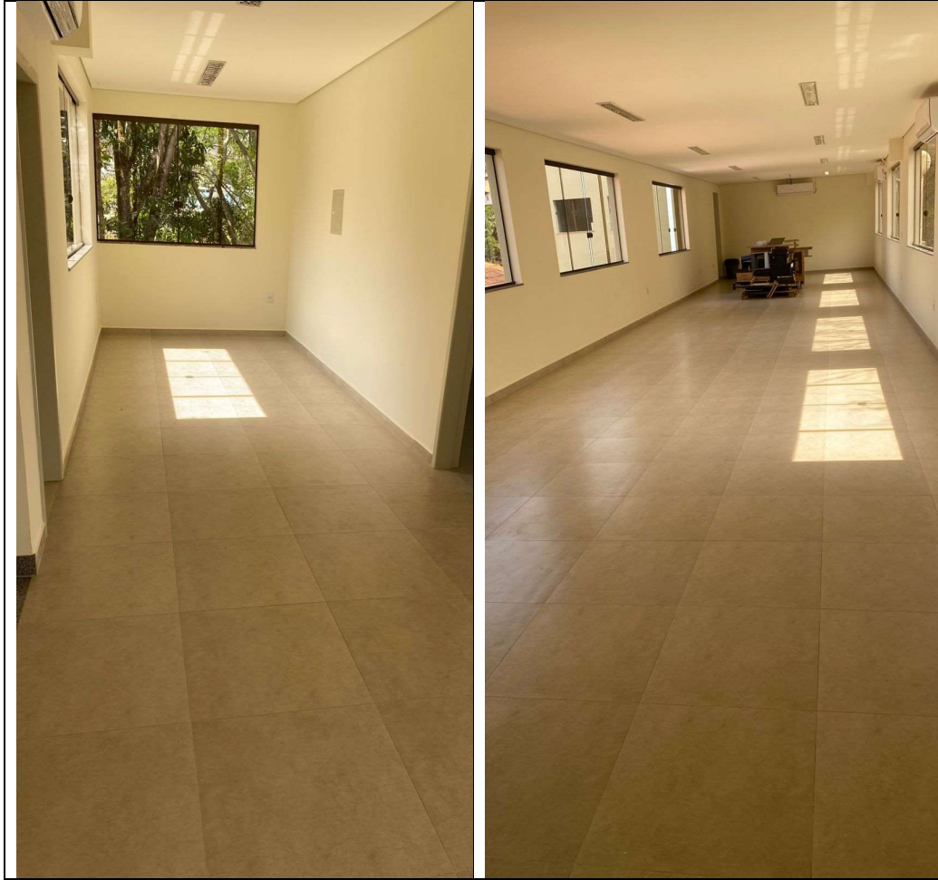
Imagens da cozinha do terceiro pavimento

CONSÓRCIO INTERMUNICIPAL MULTISETTORIAL DO VALE DO PIRANGA