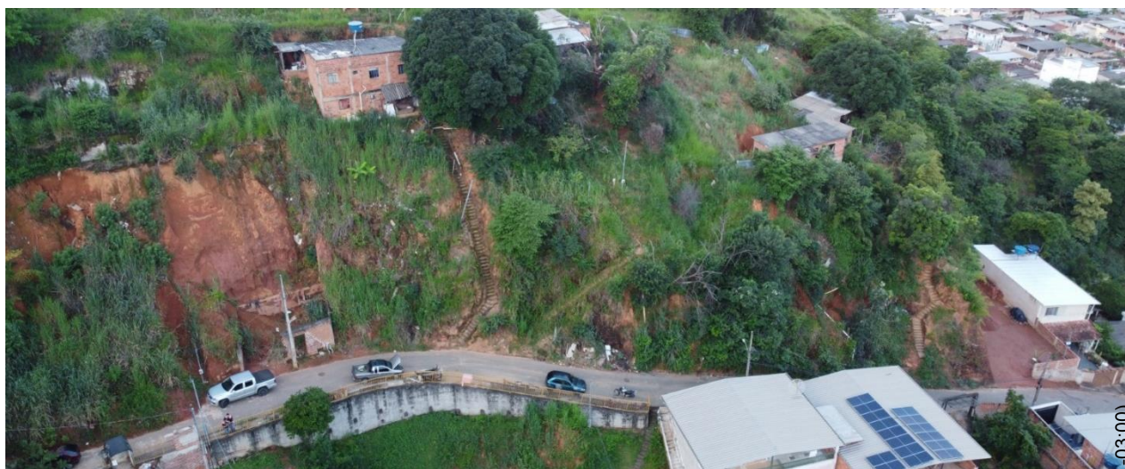
Fig.05 – Foto aérea