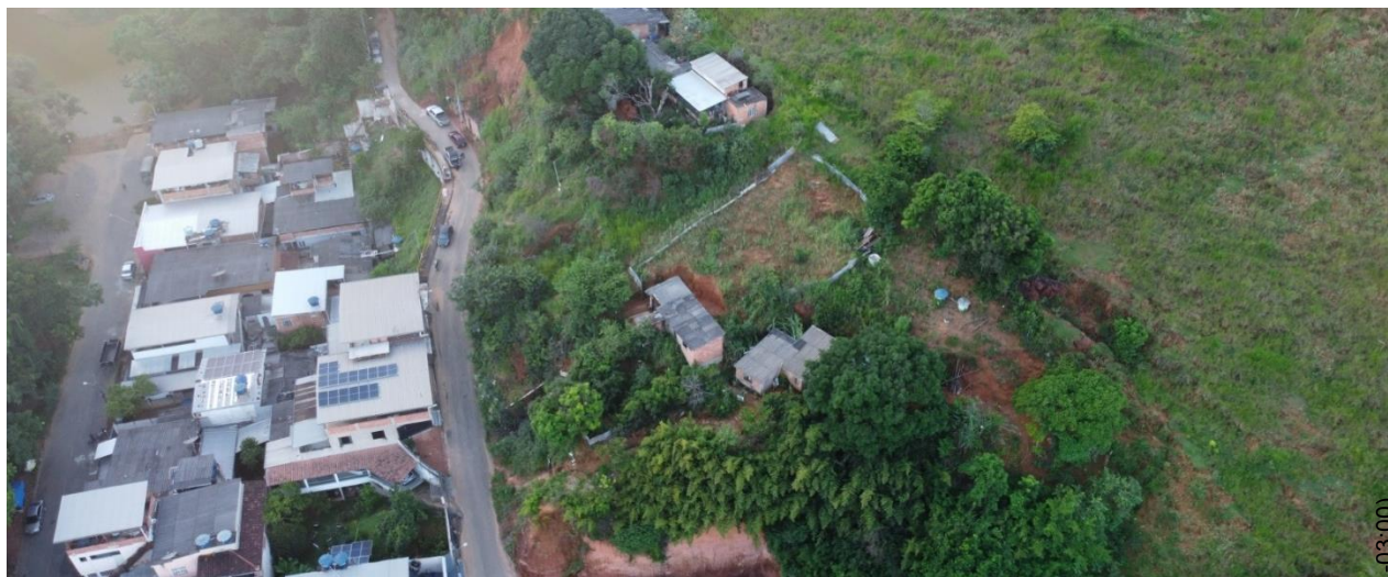
Fig.03 – Foto aérea