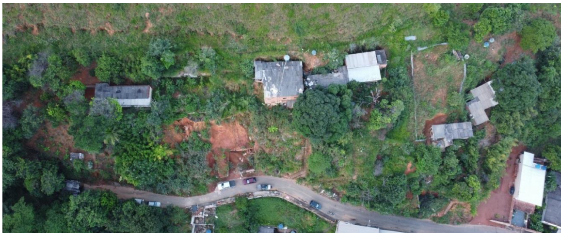
Fig.01 – Foto aérea