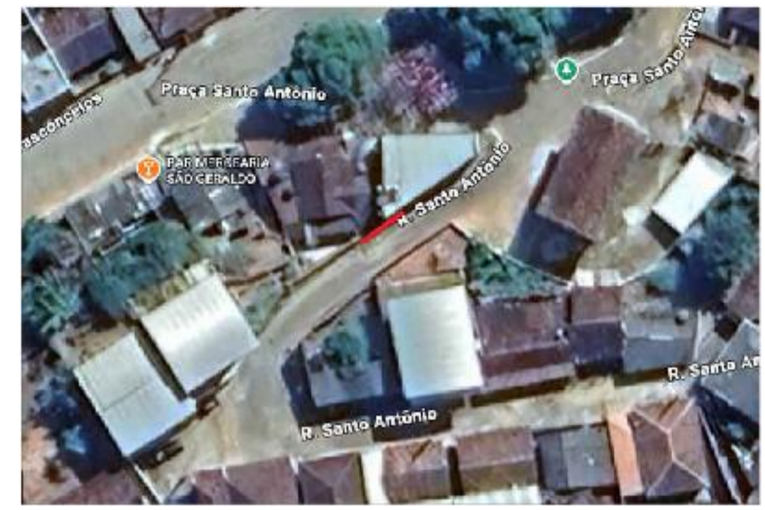
LOCAL DE LOCALIZAÇÃO SEM ESCALA