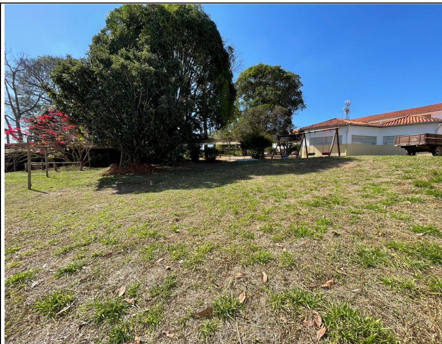
Descrição: Vista Lateral esquerda ao terreno.