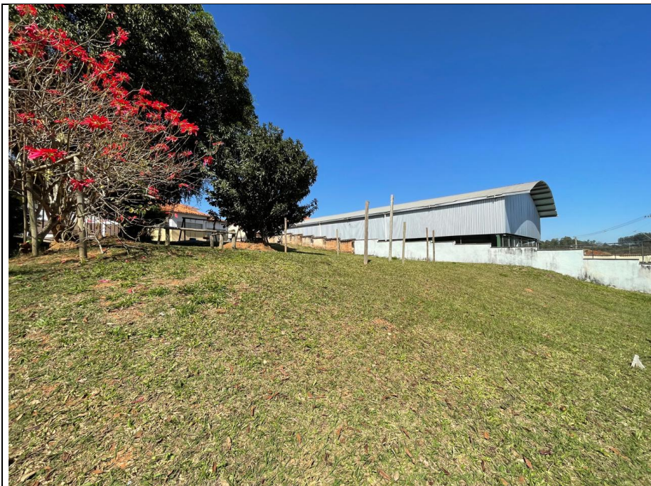
Descrição: Vista lateral direita ao terreno.

ESTADO DE MINAS GERAIS - CNPJ: 20.356.747.0001/94