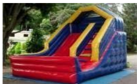
Tobogã (foto ilustrativa)

Descrição Técnica: Tobogã inflável tradicional pequeno, com subida frontal e com o fundo no topo telado, o que dá mais proteção aos usuários. / Brinquedo inflável confeccionado em kp-1000, em solda eletrônica, dimensões aproximadas de 3,00 m (Largura) x 5,00 m (Comprimento) x 4 m (Altura), acompanha motor para inflar o brinquedo com voltagem compatível com o local da sua instalação.