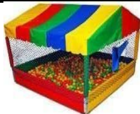
Piscina de bolinhas (foto ilustrativa)

Estrutura em ferro e base feita de madeira revestida com lona e espuma / rede de proteção com abertura de malha 5. No interior devem ser colocadas 1000 Bolinhas ou mais, a depender do