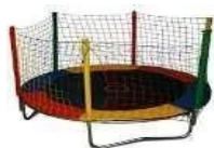
Cama Elástica (foto ilustrativa)]

descrição Técnica/Especificações: estrutura de Aço Galvanizado (int. e ext.). / sistema de Impulsão acima de 80 molas / pés inteiros que deem segurança à estrutura / lona de Salto c/ Proteção UV (Colorida) / proteção de molas coloridas em espuma c/revestimento em PVC / rede de Proteção em Polipropileno multicolorida (Malha 10) / escada de acesso que Suporte até 150 kg. / brinquedo em cores variadas / dimensões aproximadas: 4,30 Mts (diâmetro); Altura - 90cm.