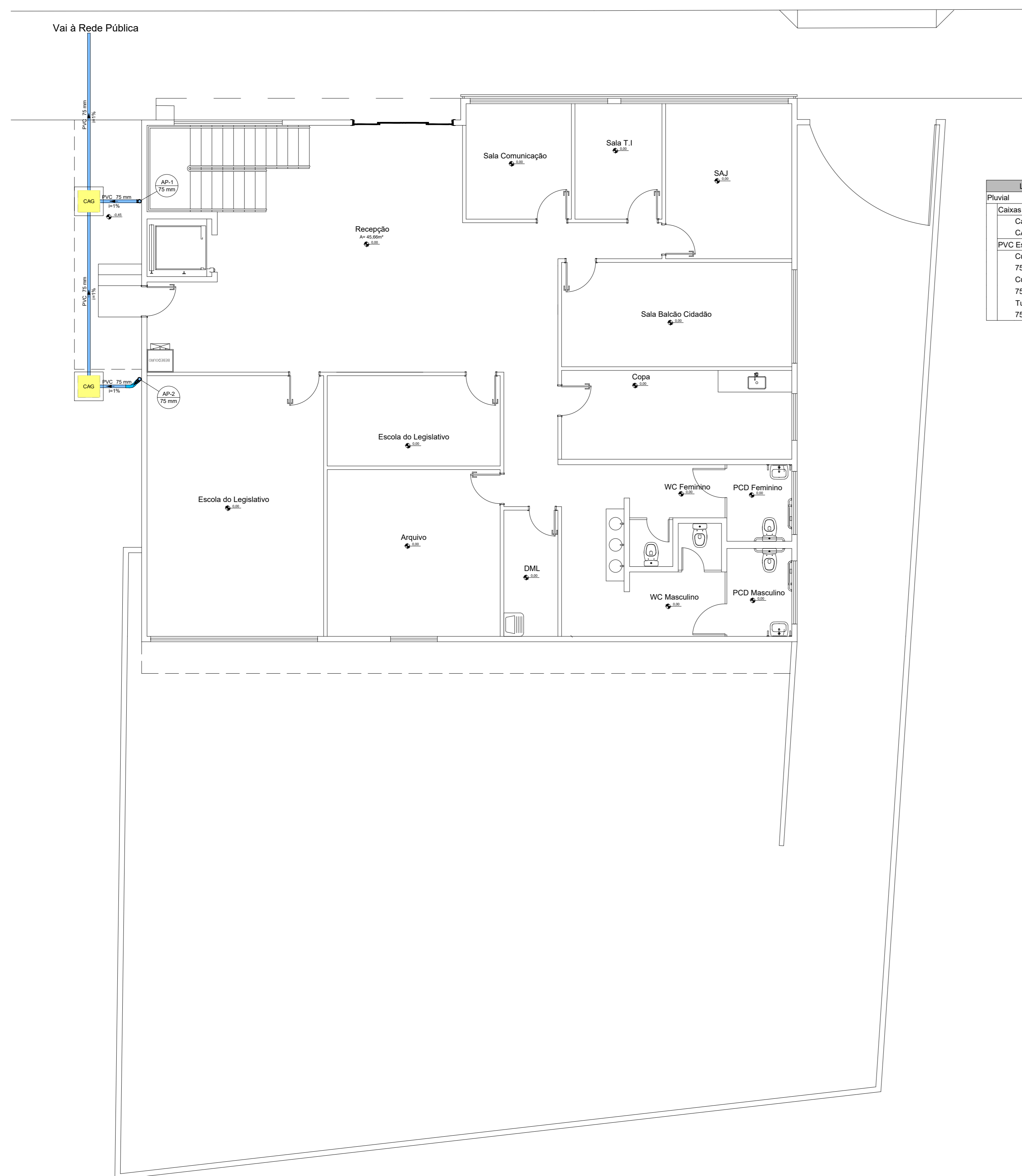
INSTALAÇÕES SANITÁRIAS - TÉRREO ESCALA 1/75