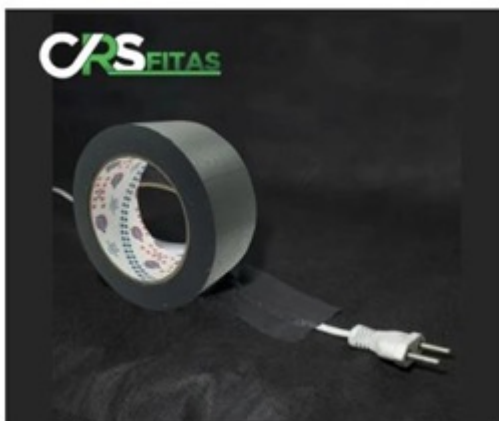
CREMER – ref. 720