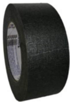
Crepe black 720 48mmX50m