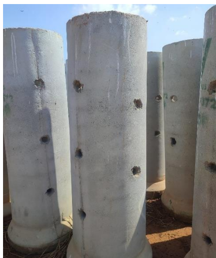
Figura 1: Tubo de concreto perfurado