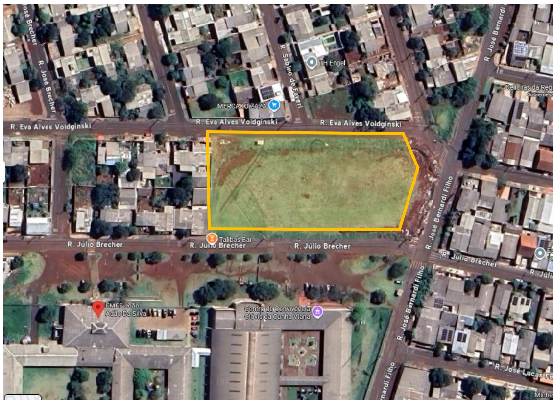
Imagem aproximada com identificação do lote, destaque na poligonal amarela.

Protocolo nº 21.612.885-0 EDITAL (Página 60 de 145) Concorrência Eletrônica nº 26/2026 – GMS Concorrência Eletrônica nº 90026/2026 - PNCP - UASG Fundepar 929906