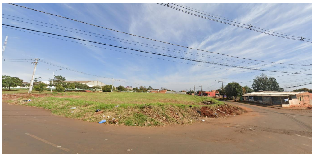
Figura 14- Atendimento de rede da Copel do outro lado da rua.