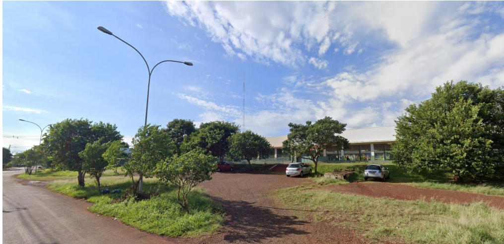
Figura 3 - Rua Júlio Brecher e Complexo Educacional Prefeito Clóvis Cunha Vianna (frente terreno) – Fonte:Google Streetview

Protocolo nº 21.612.885-0 EDITAL (Página 124 de 145) Concorrência Eletrônica nº 26/2026 – GMS Concorrência Eletrônica nº 90026/2026 - PNCP - UASG Fundepar 929906