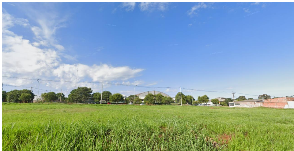
Figura 11 - Vista do terreno para Complexo Educacional Prefeito Clóvis Cunha Vianna.