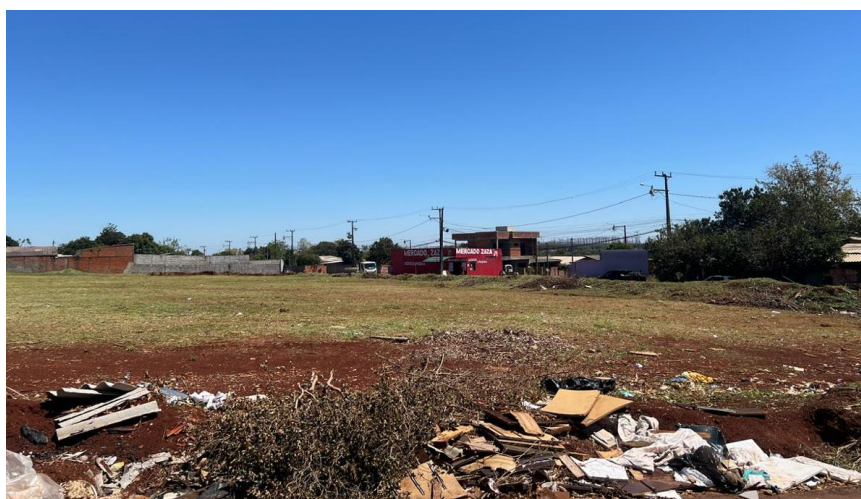
Figura 5 – Vista para o terreno e seu entorno – Rua José Bernardi Filho