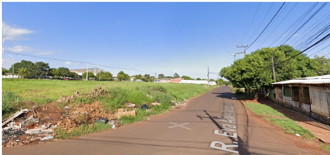
Figura 8 - Rua Eva Alves Voidginski e terreno (à esquerda)