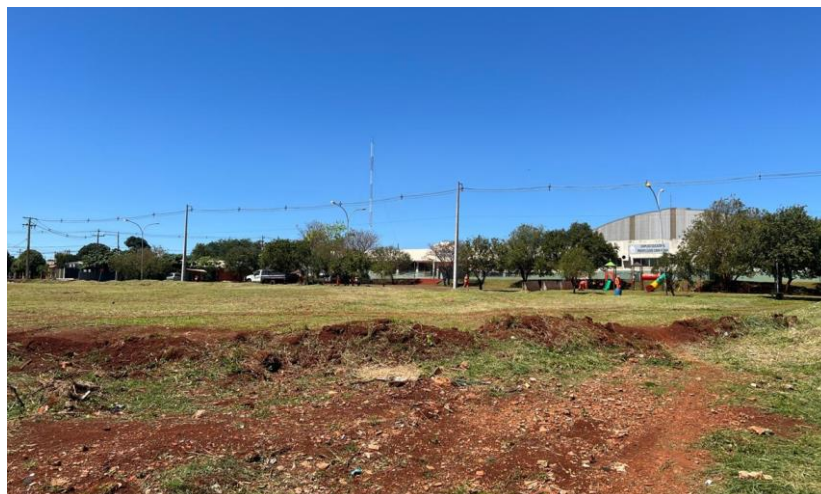
Figura 10 - Vista do terreno para Complexo Educacional Prefeito Clóvis Cunha Vianna.