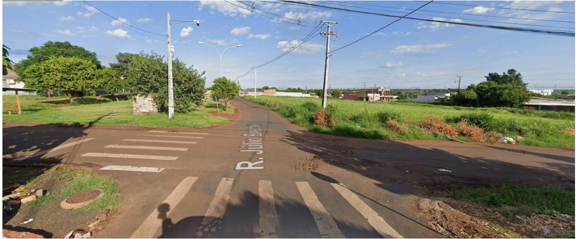
Figura 15 – Atendimento de rede da Sanepar e Copel ( outro lado da rua)- Intercessão Ruas Júlio Brecher e José Berardi Filho

Protocolo nº 21.612.885-0 EDITAL (Página 128 de 145) Concorrência Eletrônica nº 26/2026 – GMS Concorrência Eletrônica nº 90026/2026 - PNCP - UASG Fundepar 929906