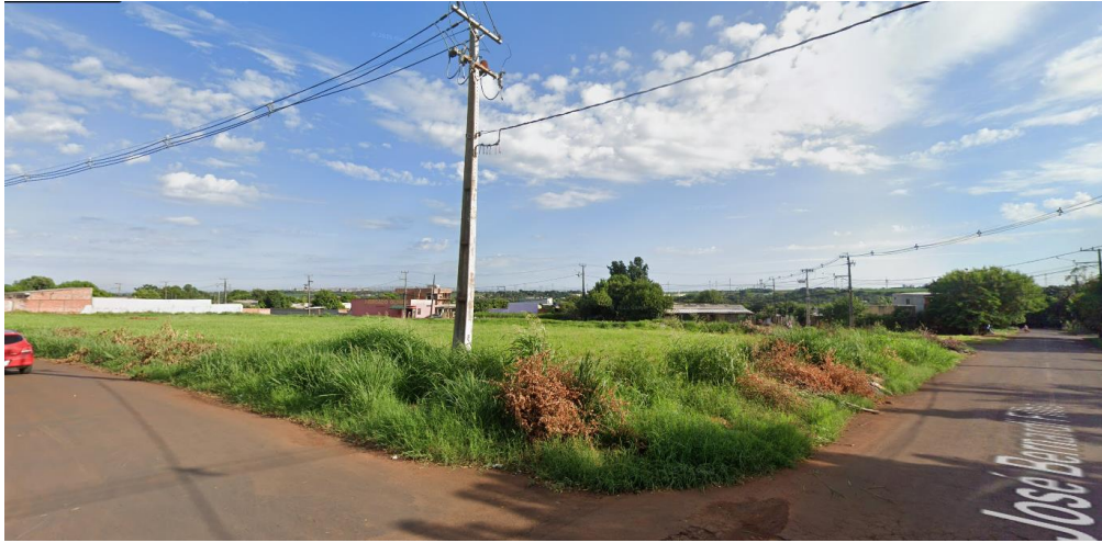
Figura 6 - Vista do terreno – Intercessão Ruas Júlio Brecher e José Berardi Filho

Protocolo nº 21.612.885-0 EDITAL (Página 125 de 145) Concorrência Eletrônica nº 26/2026 – GMS Concorrência Eletrônica nº 90026/2026 - PNCP - UASG Fundepar 929906