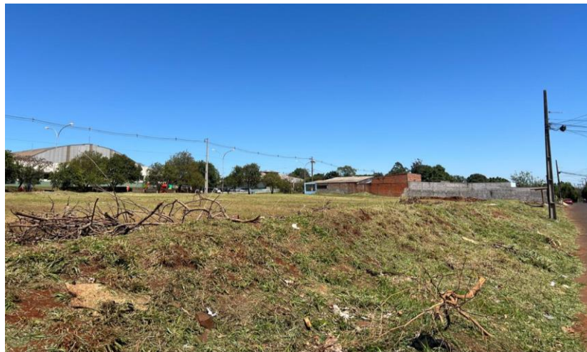
Figura 7 - Vista para terreno – Rua Eva Alves Voidginski.