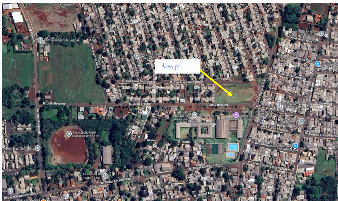
Localização do CE Santa Rita, área para a UNV e novos loteamentos em Foz do Iguaçu.

Tal situação está evidenciada na Solicitação nº 21.759, registrada no Sistema Obras Online, a qual trata da construção de uma nova unidade escolar. A justificativa apresentada fundamenta-se na necessidade de ampliar o atendimento à crescente demanda de estudantes residentes nos novos conjuntos habitacionais do Bairro Três Lagoas, no município de Foz do Iguaçu. Além disso, destaca-se o expressivo número de alunos atualmente matriculados no período noturno do Colégio Estadual Dr. Arnaldo Busatto, o que reforça a urgência na implantação de uma nova estrutura educacional capaz de descentralizar o atendimento, reduzir a sobrecarga existente e garantir melhores condições de ensino e aprendizagem à comunidade local.