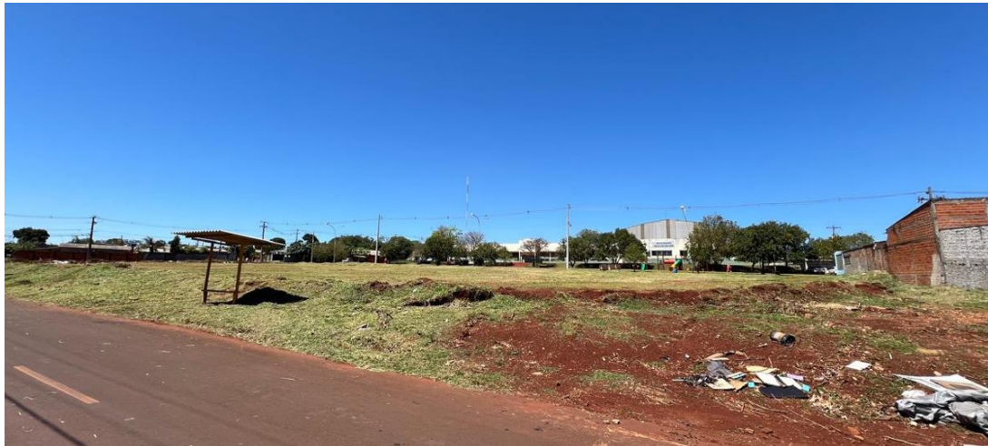
Figura 12 - Terreno visto da Rua Eva Alves Voidginski, com ponto de ônibus em frente.

Protocolo nº 21.612.885-0 EDITAL (Página 127 de 145) Concorrência Eletrônica nº 26/2026 – GMS Concorrência Eletrônica nº 90026/2026 - PNCP - UASG Fundepar 929906