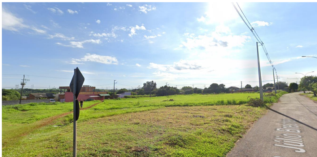
Figura 2 - Vista para o terreno - Rua Júlio Brecher – Fonte:Google Streetview