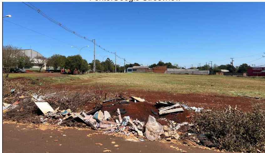
Figura 4 – Vista para o terreno e seu entorno – Rua José Bernardi Filho