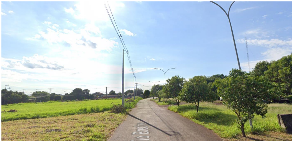
Figura 1 - Rua Júlio Brecher e terreno (à direita)

Terreno para para a futura construção da Unidade Nova Escolar – UNV Santa Rita, Município de Foz do Iguaçu, de propriedade do Estado do Paraná, contendo uma área de 5.929,60m 2 , Rua Júlio Brecher, nº 2385, Loteamento Lagoa Dourada. As imagens do terreno foram registradas em vistoria técnica realizada em 25 de setembro de 2025 e capturadas do Google Street View em 11 de novembro de 2025.