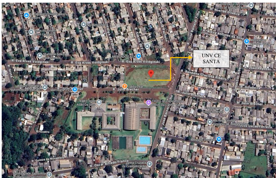
Vista aérea do terreno para construção da UNV CE Santa Rita – EFM, Foz do Iguaçu/PR.

Coordenadas Geográficas: Latitude 25°29'00.5"S, Longitude 54°31'02.6" O