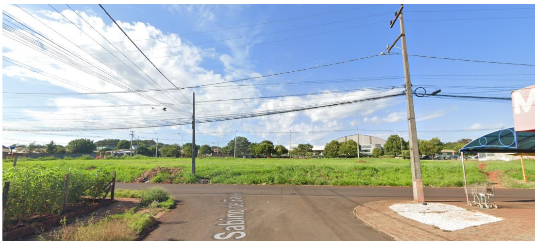
Figura 13 - Vista do terreno e seu entorno – Rua Sabino de Faveri