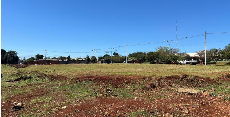
Figura 9 - Vista para terreno – Rua Eva Alves Voidginski.

Protocolo nº 21.612.885-0 EDITAL (Página 126 de 145) Concorrência Eletrônica nº 26/2026 – GMS Concorrência Eletrônica nº 90026/2026 - PNCP - UASG Fundepar 929906