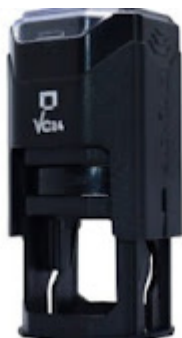
Nykom - 2 x 2 cm .jpeg 8K