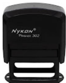
Nykom - 3,8 x 1,4 cm .jpeg 65K