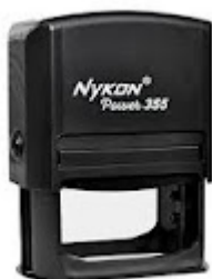
Nykom - 6 x 4 cm .jpeg 7K