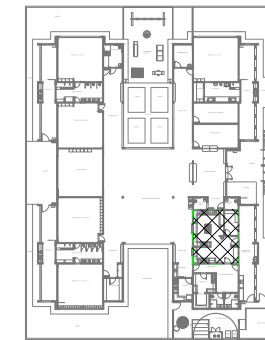
CRQUI DE REFERÊNCIA