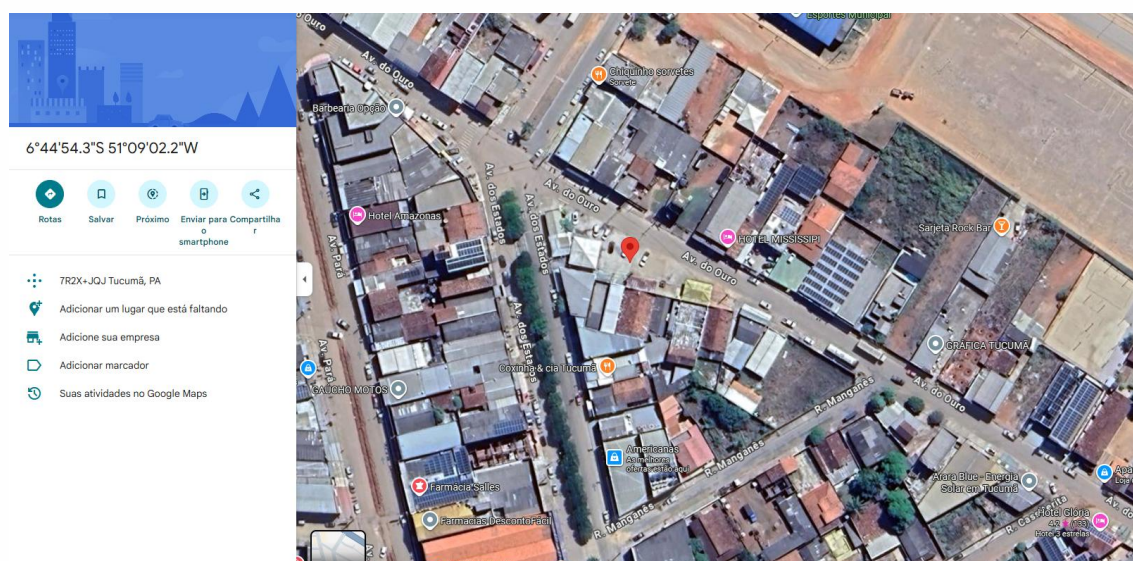
Imagem 01: Ponto de coordenada praça 2025/2028

Localização do empreendimento conforme imagem abaixo: