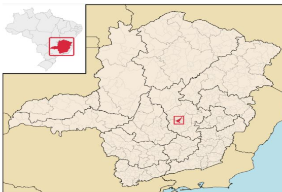
Localização do Município de Pedro Leopoldo em Minas Gerais

O município de Pedro Leopoldo está localizado na Região Metropolitana de Belo Horizonte, em Minas Gerais, a 46 quilômetros a noroeste da capital mineira, com acesso pelas rodovias estaduais MG-010 e MG-424. Está situado a aproximadamente 11 quilômetros do Aeroporto Internacional Tancredo Neves, o maior do estado. Parte de seu território encontra-se na Área de Proteção Ambiental (APA) Carste de Lagoa Santa. A área territorial do município é de 292,831 km 2 (IBGE, 2023).