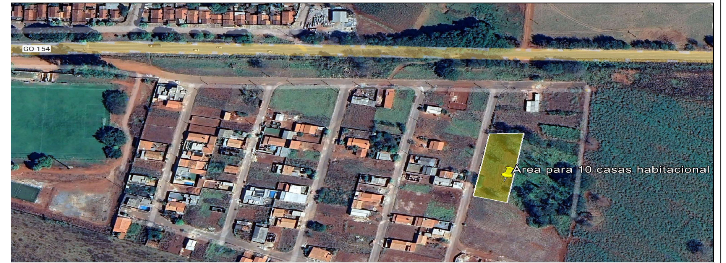
IMAGEM LOCALIZAÇÃO - RESIDENCIAL BENEDITO CABRAL