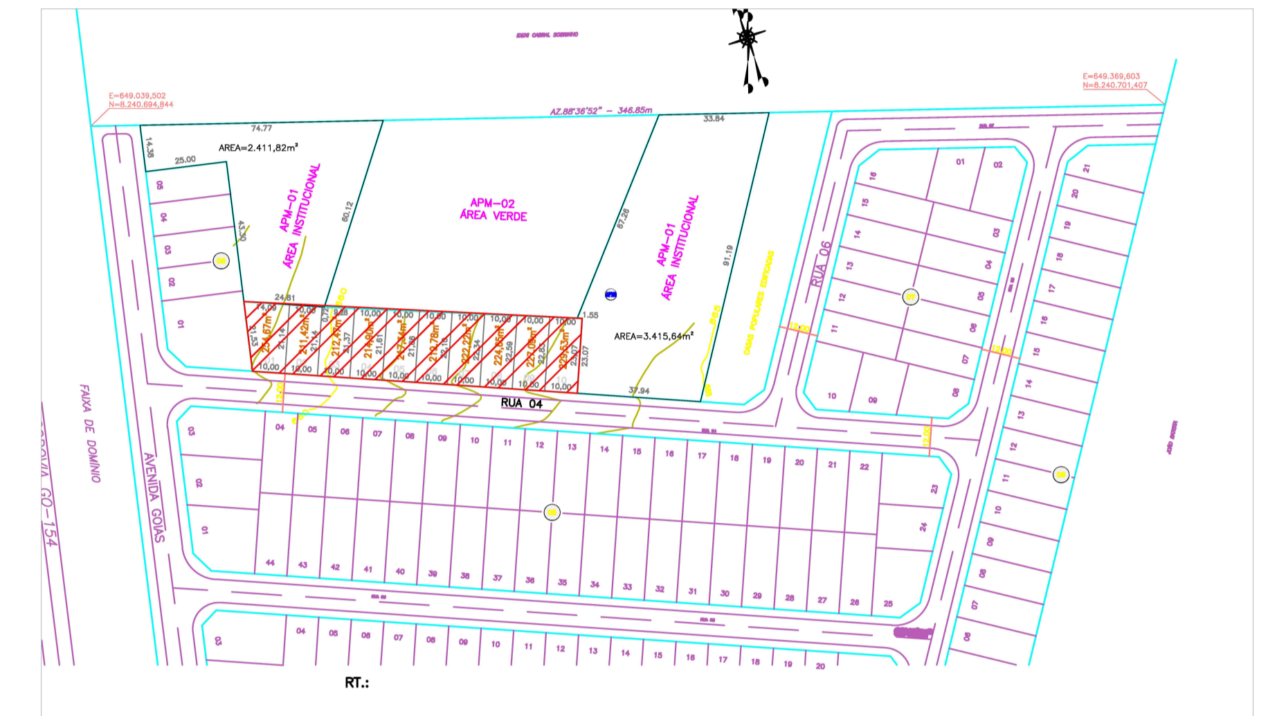
PLANTA DE SITUAÇÃO - RESIDENCIAL BENEDITO CABRAL