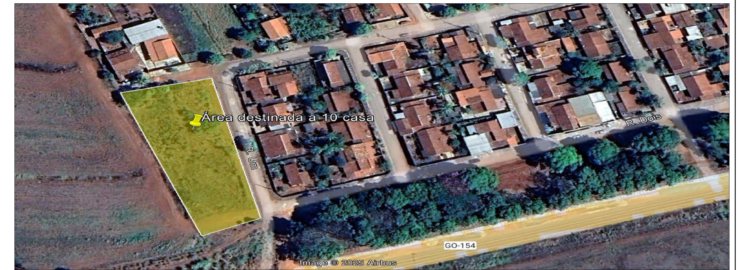
IMAGEM LOCALIZAÇÃO - RESIDENCIAL BENEDITO CABRAL