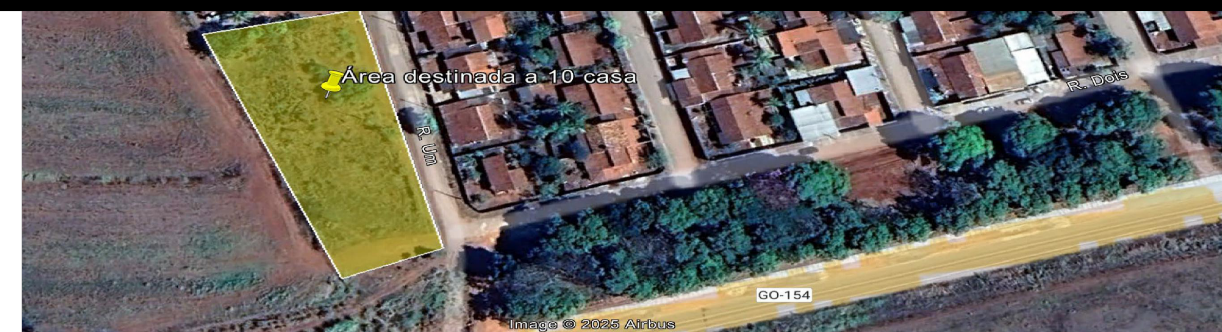
IMAGEM LOCALIZAÇÃO - LOTEAMENTO TRES PODERES