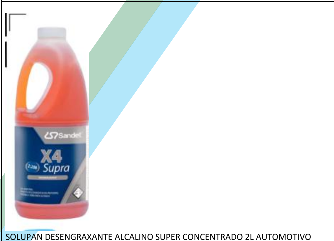
SOLUPAN DESENGRAXANTE ALCALINO SUPER CONCENTRADO 2L AUTOMOTIVO