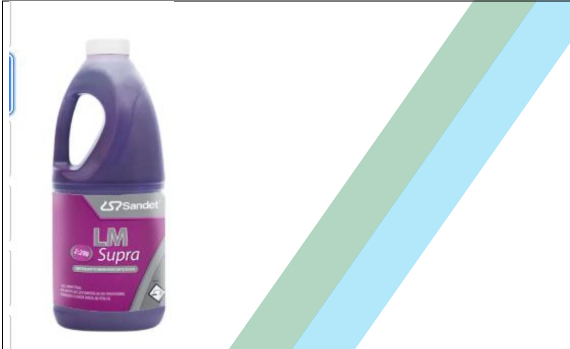
Desincrustante Ácido Ultra concentrado