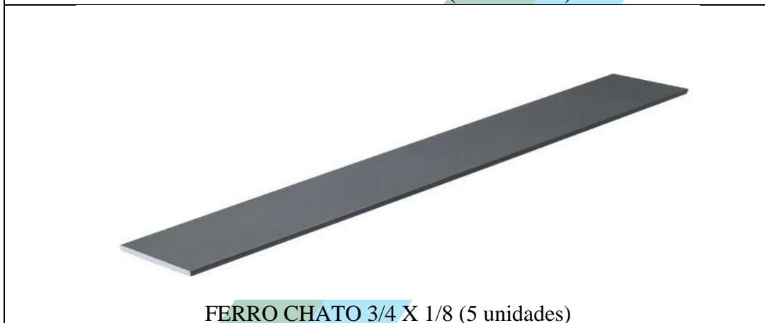
FERRO CHATO 3/4 X 1/8 (5 unidades)