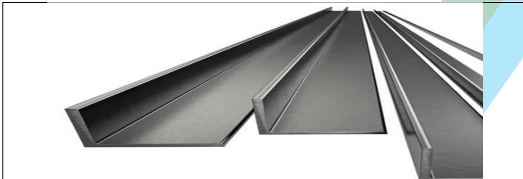
CANTONEIRA 7/8 X 1/8 (05 unidades)