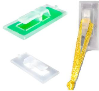
Suporte Clip Fixa Balão Bexiga Bubble Adesivo Multiuso 100un