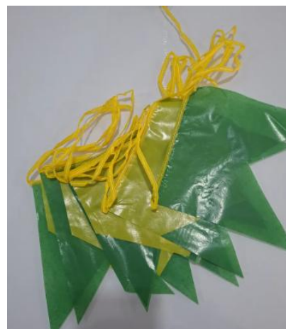
Bandeirinha Brasil Decoração 100m Varal Bandeirolas Plástico