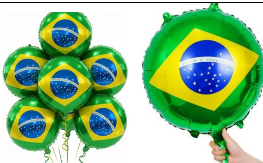
Balão Brasil Redondo Metalizado 45cm Copa Mundo Seleção Brasil Redondo 45cm, PCT COM 10 UND