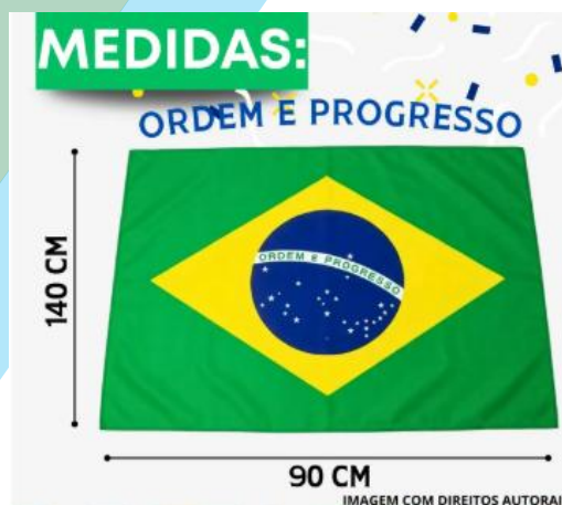
Bandeira Do Brasil Oficial Mastro Copa Do Mundo